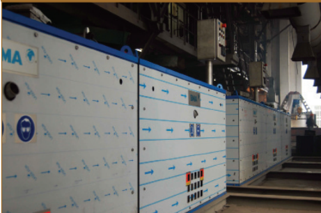
Центрифуги фірми ВМА