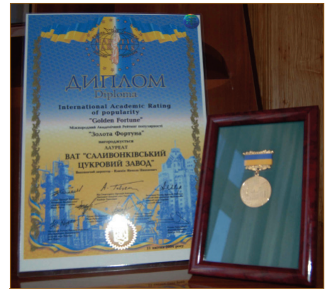
Нагороди та дипломи

У тому ж 1998 році заводчани урочисто відзначили 125-річний ювілей підприємства. Зі святом підприємство вітали численними грамотами та нагородами.