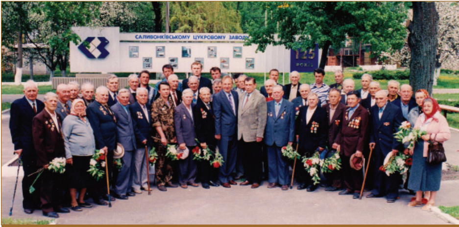
Ветерани Великої Вітчизняної Війни, 1998 рік