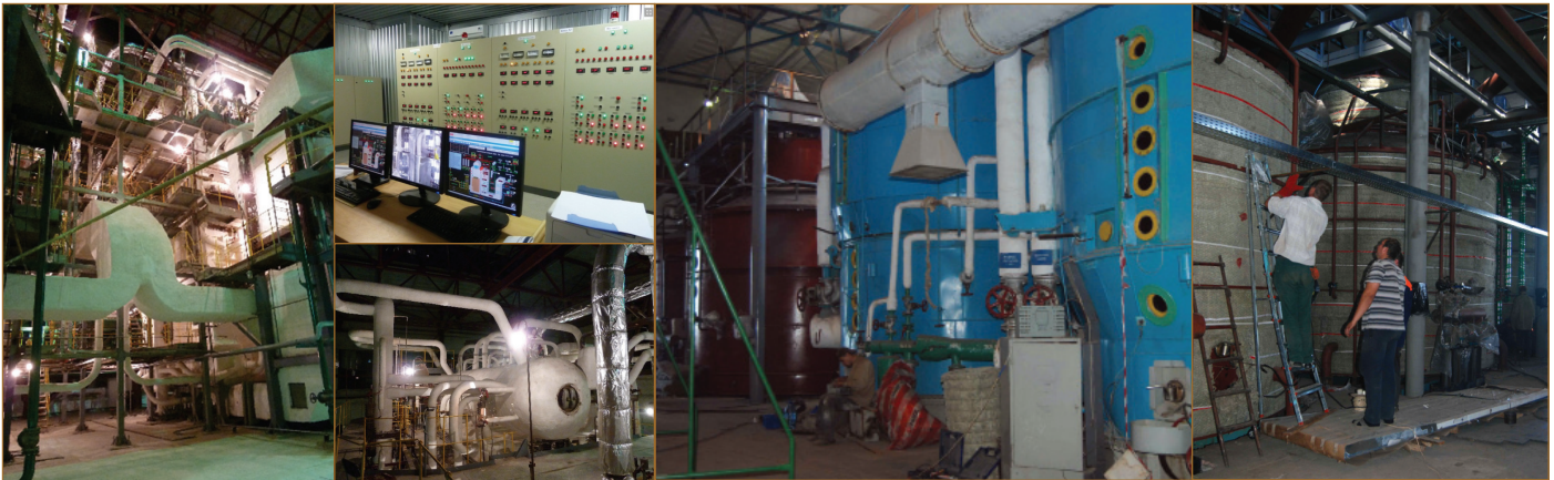
Комплекс робіт з автоматизації парових котлів котлов, 2012-2013 роки