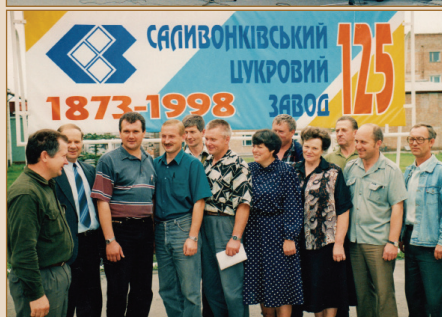
Святкування 125-річчя заводу, 1998 рік

вати свої позиції на цукровому ринку України, поступово формуючи сировинну зону, зменшуючи собівартість виробництва. Завод самостійно почав вирощувати цукрові буряки на орендованих площах у 2 тисячі гектарів. З цією метою у 1998 році на заводі було створено структурний підрозділ з виробництва сільськогосподарської продукції.