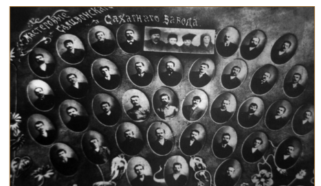
Майстри Саливонківського цукрового заводу, 20-ті роки XX століття

Цей період був непростим і для Саливонківського цукрового заводу. Нове XX-те століття розпочалося стрімким розвитком науки та техніки. Вчора ще нові технології та обладнання