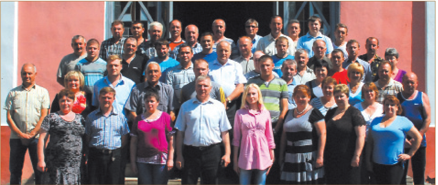
Колектив заводу, 2013 рік