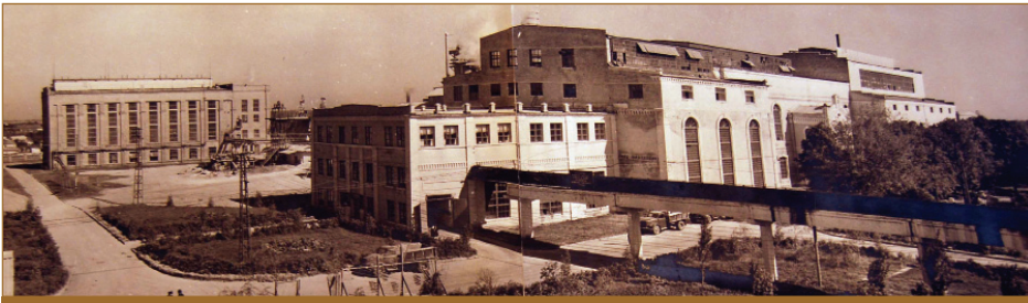
Загальний вигляд заводу, 1958 рік

ттю 3,83 тис. тонн буряків; побудовано новий продуктивний цех, де встановлені вакуум-апарати ємкістю по 500 центнерів утфелю і поверхнею нагріву 255 м 2 кожний. Для кристалізації утфелю 3-го продукту застосовувалися утфелемішалки з дисковою поверхнею охолодження ємкістю до 500 центнерів утфеля. Для сушіння цукру застосовувалась високопродуктивна компактна сушильна установка з попередньою подачею повітря по зонах. У рамках реконструкції було побудовано ТЕЦ паропроодуктивністю 72 тонни пари/год. з турбогенератором потужністю 6000 кВт та здано в експлуатацію галерею зі стрічковими транспортерами довжиною 360 метрів для подачі віджатого жому в жомову яму і на завантаження в автомашини. Повністю механізовані завантажувально-розвантажувальні роботи, а також роботи з укладки та транспортування буряків.