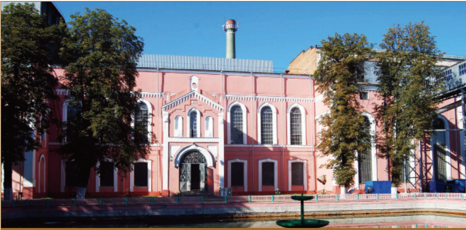
Перша цегляна будівля заводу, 1883 рік

добова переробка цукрових буряків становила 180 тонн. Вихід цукру складав 3-5% до ваги цукрової сировини. Річне виробництво не перевищувало 800 тонн.