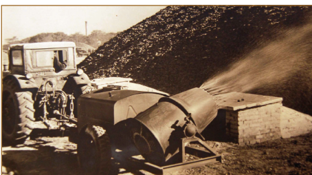
Випарвання буряків в кагатах, 1960-ті роки

У 1958-1965 роках було проведено комплексну реконструкцію Саливонківського заводу: встановлено дві безперервнодіючі дифузійні установки колонного типу продуктивністю по 1500 тонн буряків кожна; нову удосконалену фільтраційну установку в сокоочисному цеху; автоматизовану 4-корпусну випарну станцію з концентратором загальною поверхнею нагріву 8800 м 2 , яка була здатна забезпечити роботу заводу з добовою продуктивніс-