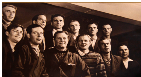
Колектив цеху КППА, 1960-ті роки