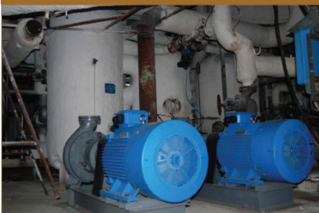
Модернізація насосного господарства, 2013 рік

У 2013 році була здійснена модернізація теплової схеми заводу, реконструкція продуктового цеху та установка 5 вакуум-апаратів I-го продукту. Також встановлені 9 центрифуг фірми ВМА, утфелерозподільники та насоси найкращих світових виробників.