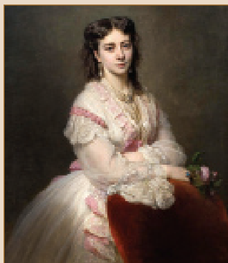
Графиня Марія Євстафіївна Сапега-Браницька

ловості на родючих українських землях. Будівництво перших цукрових заводів і ті прекрасні перспективи, які обіцяло виробни-