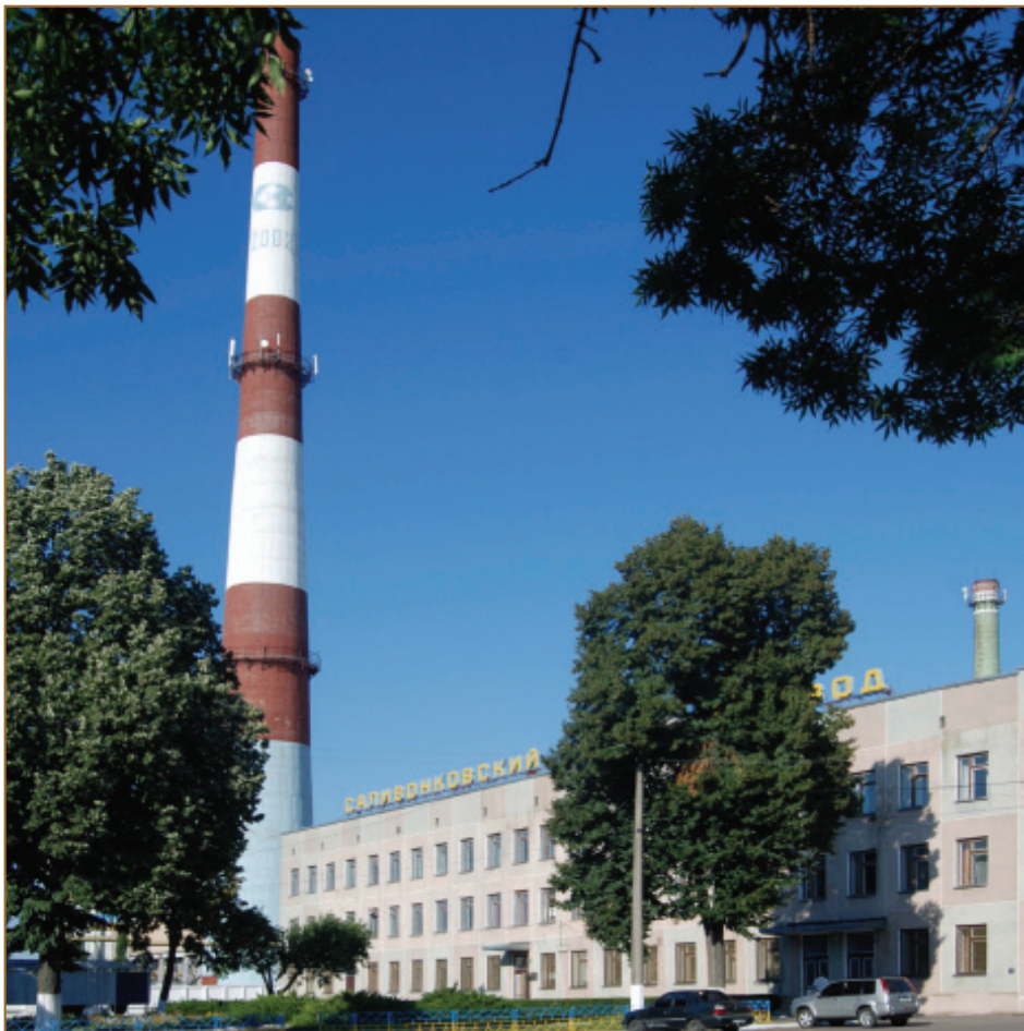
Загальний вид заводу, 2013 рік

Завод у різні часи очолювали досвідчені фахівці своєї справи та талановиті організатори.