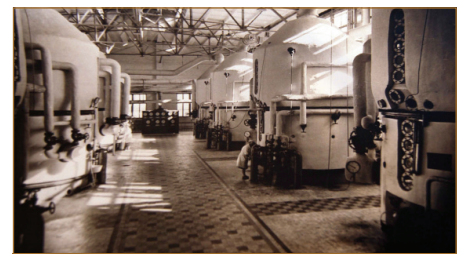
Продуктове відділення, 1960-ті роки