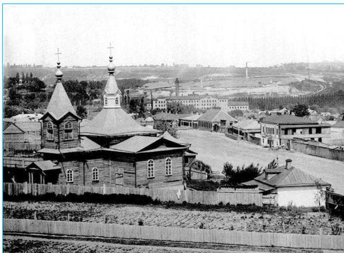
Київ - Деміївка, кін. 19 ст.

кріпосного права Деміївка «з приміського селища, - за висловом автора книги «Київ тепер і прежде» М. Захарченка, - дуже швидко перетворюється на передмістя, особливо від часу заснування тут цукрового та інших заводів».