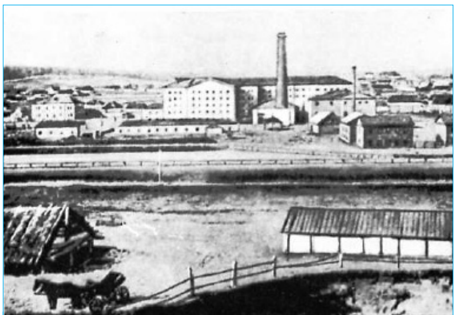
Загальний вигляд заводу, 1874 р.

У перші роки свого існування завод випускав рафінад у «головах», пізніше - кусковий різних сортів. У 1913 році асортимент продукції заводу складався з таких видів рафінаду: «голови», пиляний, рублений, кругляки та цукрова пудра; крім того, завод випускав рафінадну патоку. Спочатку рафінад постав-