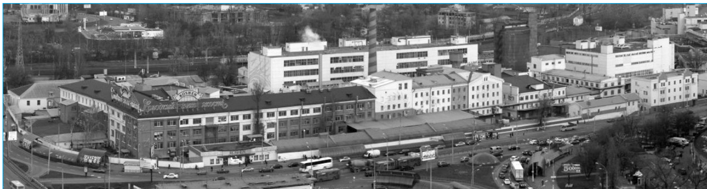
Сучасний вигляд кондитерської фабрики Roshen, м. Київ

Цукрорафінадний на той час завод був одним з найбільш прогресивних навіть серед виробництв Києва. Підприємство було обладнане найсучаснішим тогочасним устаткуванням, яке весь час оновлювалося. У технологічному процесі широко використовувалися досвідні розробки як вітчизняних, так і зарубіжних інженерів. На своїй території завод мав заклади житлового, службово-навчального та обслуговуючого призначення, власні інженерні мережі, автономне водопостачання з власних артезіанських свердловин,