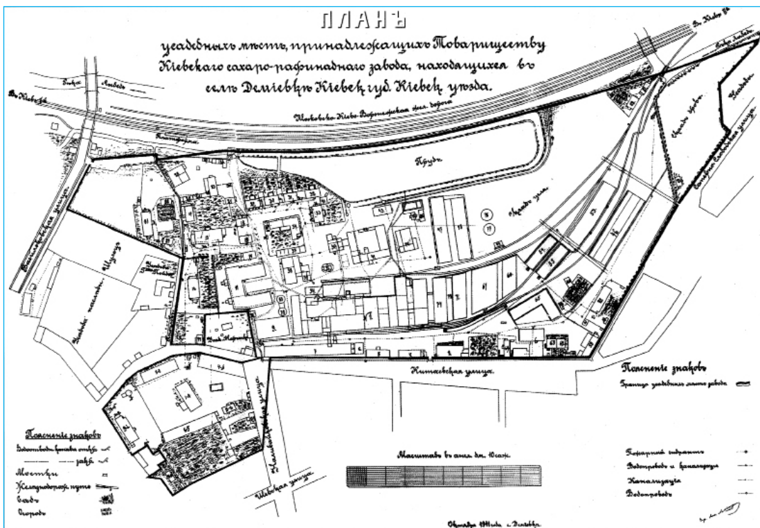
Генеральний план цукрорафінадного заводу

до залізничної станції - ¼ версти (станція - Київ II), 6 верст пароходною пристані. У другій половині XIX ст. почалося інтенсивне заселення цього району. Цьому сприяло розширення зв'язків з півднем через Великий Васильківський шлях, який