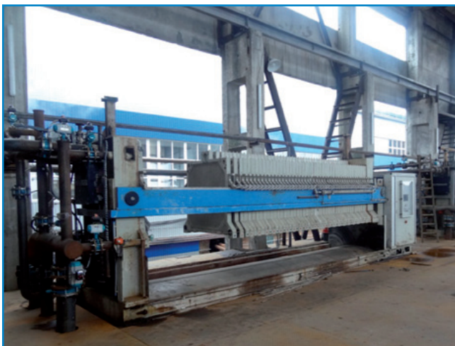
Рис. 12. Прес-фільтр «Putsch» на Глобинському цукровому заводі