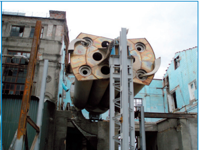
Рис. 3. Монтаж сушки цукру на Наркевицькому цукровому заводі