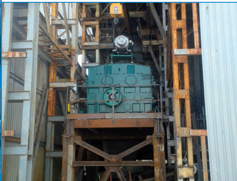
Рис. 10. Жомопрес в проектному положенні

Було виготовлено фундаменти, монтажні площадки, проведений монтаж жомопресу, демонтовані старі бункери та виготовлені та змонтовані нові. Складність робіт полягала в монтажі жомопресу ручними телями. Роботи були закінчені чітко в визначений термін. Будівництво цеху під чотири прес-фільтри, з моменту заливки фундаменту і до моменту монтажу двох прес-фільтрів з обв'язкою технологічного обладнання», відбувалось за узгодженим з заводом планом будівництва.