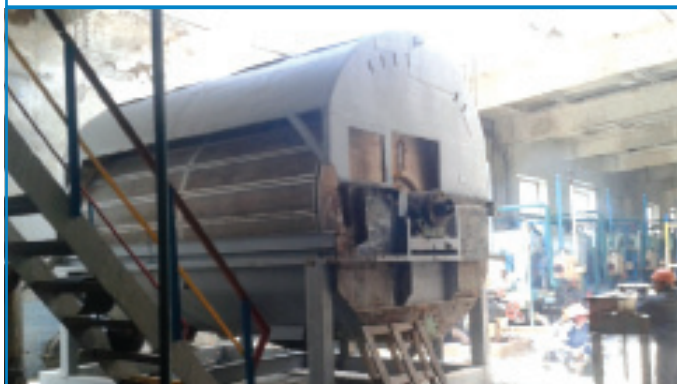
Рис.23. Монтаж вакуум-фільтра на заводі в Тихорецьку

Була виконана поставка з подальшим монтажем і введенням в експлуатацію вакуум-фільтру барабанного типу, відновлення «павука» на вже наявному вакуум-фільтрі БШ-40, капітальний ремонт двох буртоукладчиків БУМ Ш-1-ВКФ і введення їх в експлуатацію. Завод успішно увійшов в виробничий режим сезону 2016/17. Замовник претензій за обсягом, якістю і термінами надання послуг не мав.