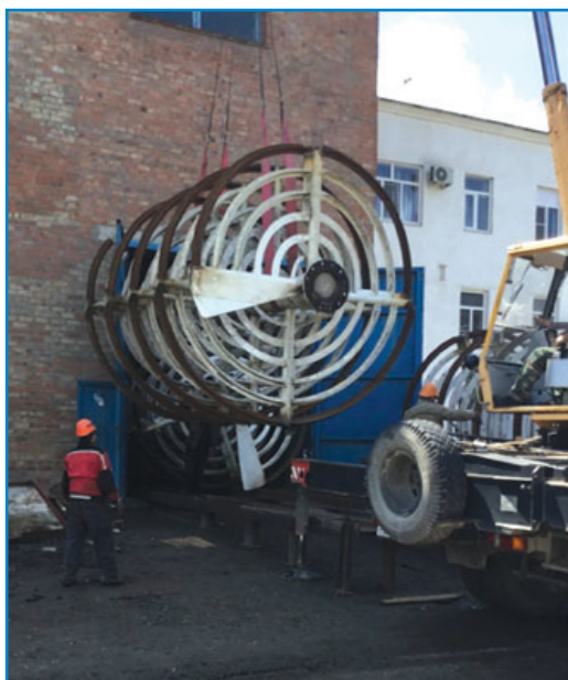
Рис. 19. Подача відреставрованих шнеків в будівлю заводу