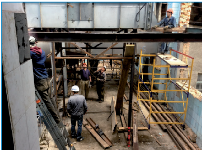
Рис. 5. Монтаж технологічних площадок

Грамотна розмітка та чіткість плазмового різання дозволили перевезти і акуратно зібрати (зварити) сушку цукру на «Наркевицькому цукровому заводі».