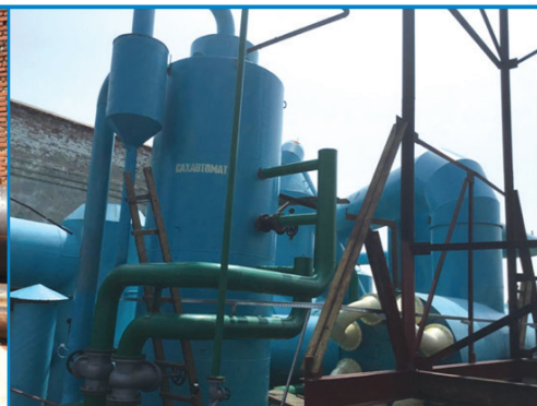
Рис. 22. Модернізація ВКУ закінчена