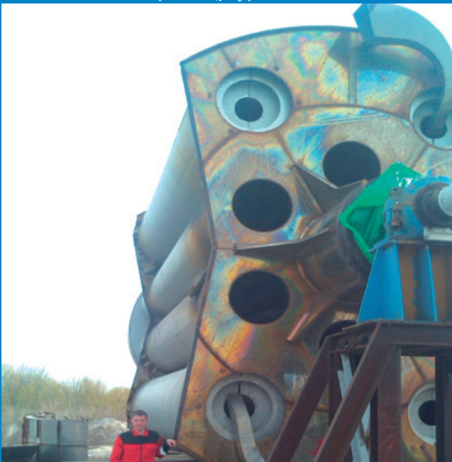
Рис. 2. Сушка цукру, порізна на частини для транспортування