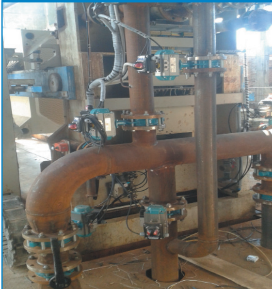
Рис. 14. Обв'язка ПКФ