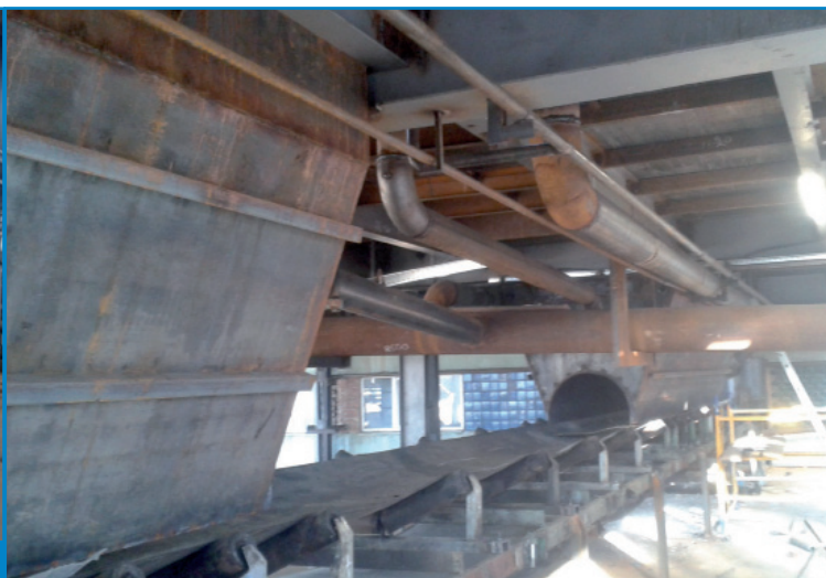
Рис. 13. Бункер під ПКФ