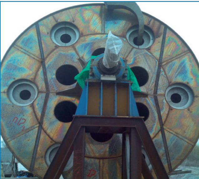
Рис. 1. Сушка цукру «Fives-Cail»

Роботи з будівництва цукросушильного комплексу на Наркевицькому цукровому заводі було розпочато в квітні в 2016 року з перевезенням сушки цукру фірмою «Fives-Cail» з Глобинського цукрового заводу на Наркевицький. Складність роботи полягала в необхідності розділити сушку цукру на кілька частин для транспортування.