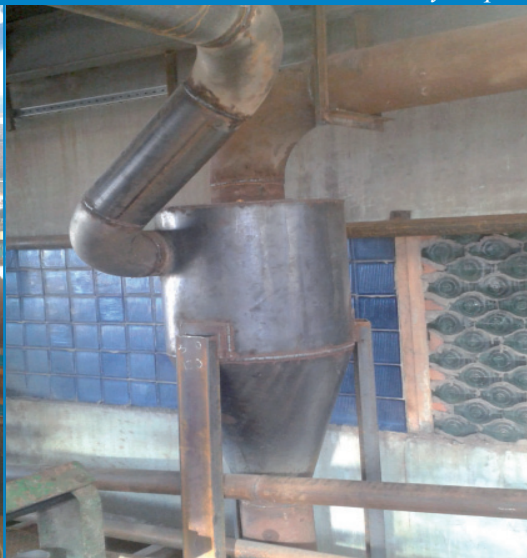
Рис. 15. Виготовлення циклонів на будівельній ділянці

Все обладнання було змонтовано 20 серпня 2016 року.