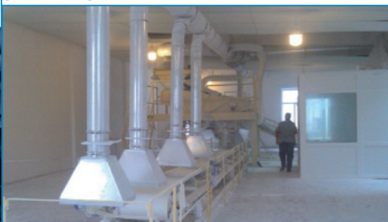
Рис. 8. Продуктовий цех

Пуск заводу був проведений в намічений заводом термін - 24 серпня. Пуск пройшов успішно.