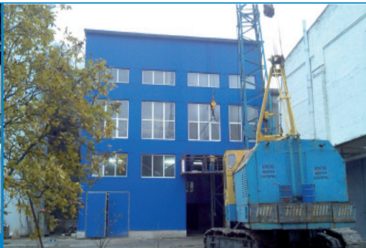
Рис. 6. Монтаж сендвіч-панелей

Грамотна розмітка та чіткість плазмового різання дозволили перевезти і акуратно зібрати (зварити) сушку цукру на «Наркевицькому цукровому заводі».