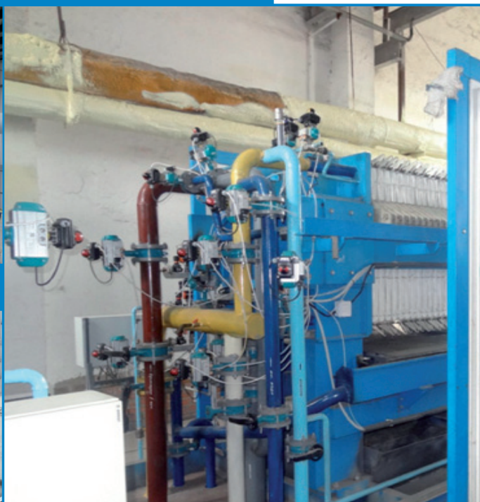
Рис. 17. Обв'язка прес-фільтру «Sismat»