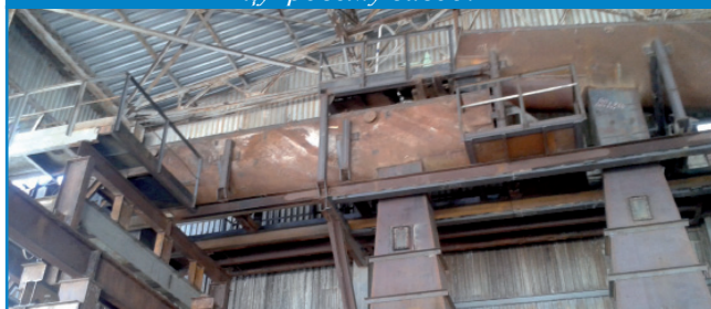
Рис. 11. Виготовлення та заміна завантажувальних бункерів