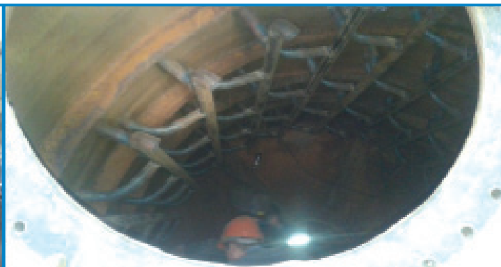
Рис.24. Капремонт «павука» в вакуум-фільтрі