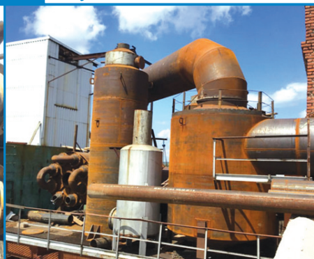
Рис. 21. Трубная обв'язка ВКУ