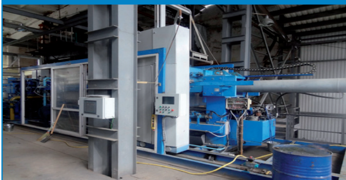
Рис. 16. Установа прес-фільтру «Sismat» на Новоіванівському цукровому заводі