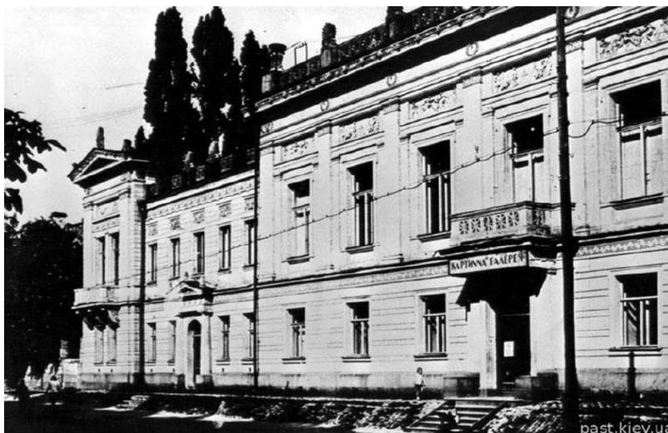
Київський музей російського мистецтва, 1930 рік