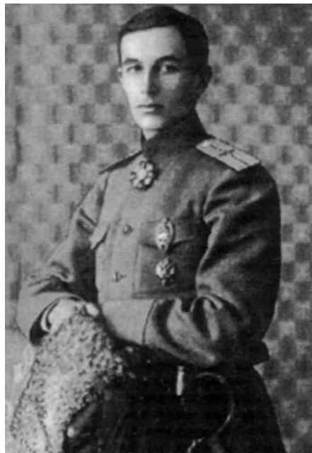
Іван Ніколович Терещенко

тим не менше приділяв багато уваги діяльності професійної спілки цукрозаводчиків і підтримки цієї галузі, особливо під час великої економічної кризи 1888 року, допомагаючи таким чином опосередковано, але дуже ефективно своєму вже немолодому батькові.