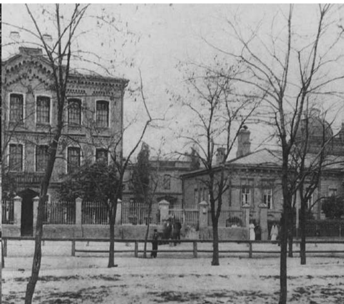
Нічний притулок на 500 бездомних і пологовий притулок для бідних на Нижньому Валу