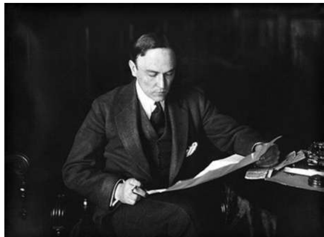
Михайло Іванович Терещенко

Його освітою займався батько. Михайло був дуже обдарованою дитиною, що володів даром не тільки засвоювати знання, а й бажанням їх отримувати. Близькі називали його вундеркіндом, що повністю відповідало дійсності.