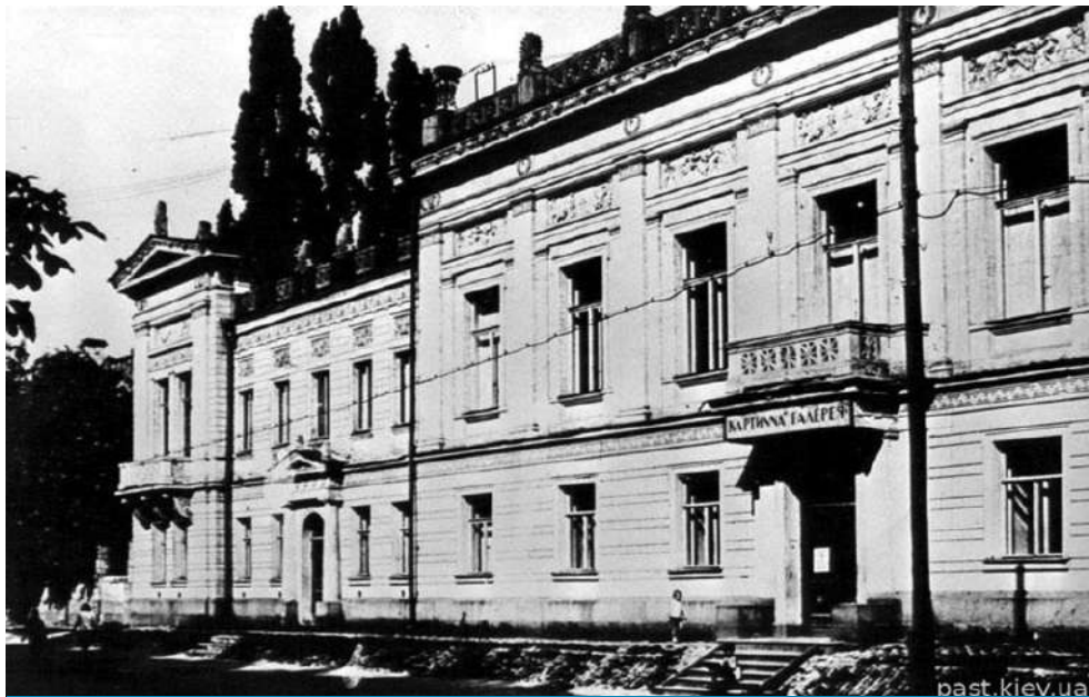
Київський музей російського мистецтва, 1930 рік

На жаль, художнє зібрання Н. Терещенка очікувала драматична доля. У 1917 році його будинок на Бібіковському бульварі відібрали більшовики. Звалена в кімнаті колекція під час обстрілу Києва в 1918 році була розграбована; частину картин знищили. Те, що вціліло, відправили до Петрограда. Деякі твори об'єднали з колекцією