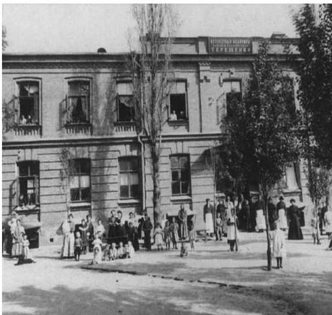
Будинок безкоштовних квартир для бідних вдів і старих жінок на Нижньому Валу