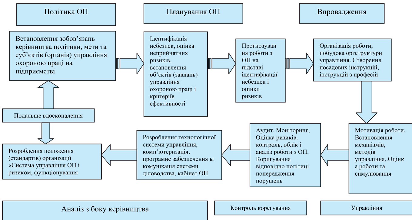
Рис. 1. Етапи розроблення та подальшого вдосконалення системи управління охороною праці.

Виконання вимог державної політики і політики підприємства з охорони праці - пріоритет здоров'я та життя працівника.