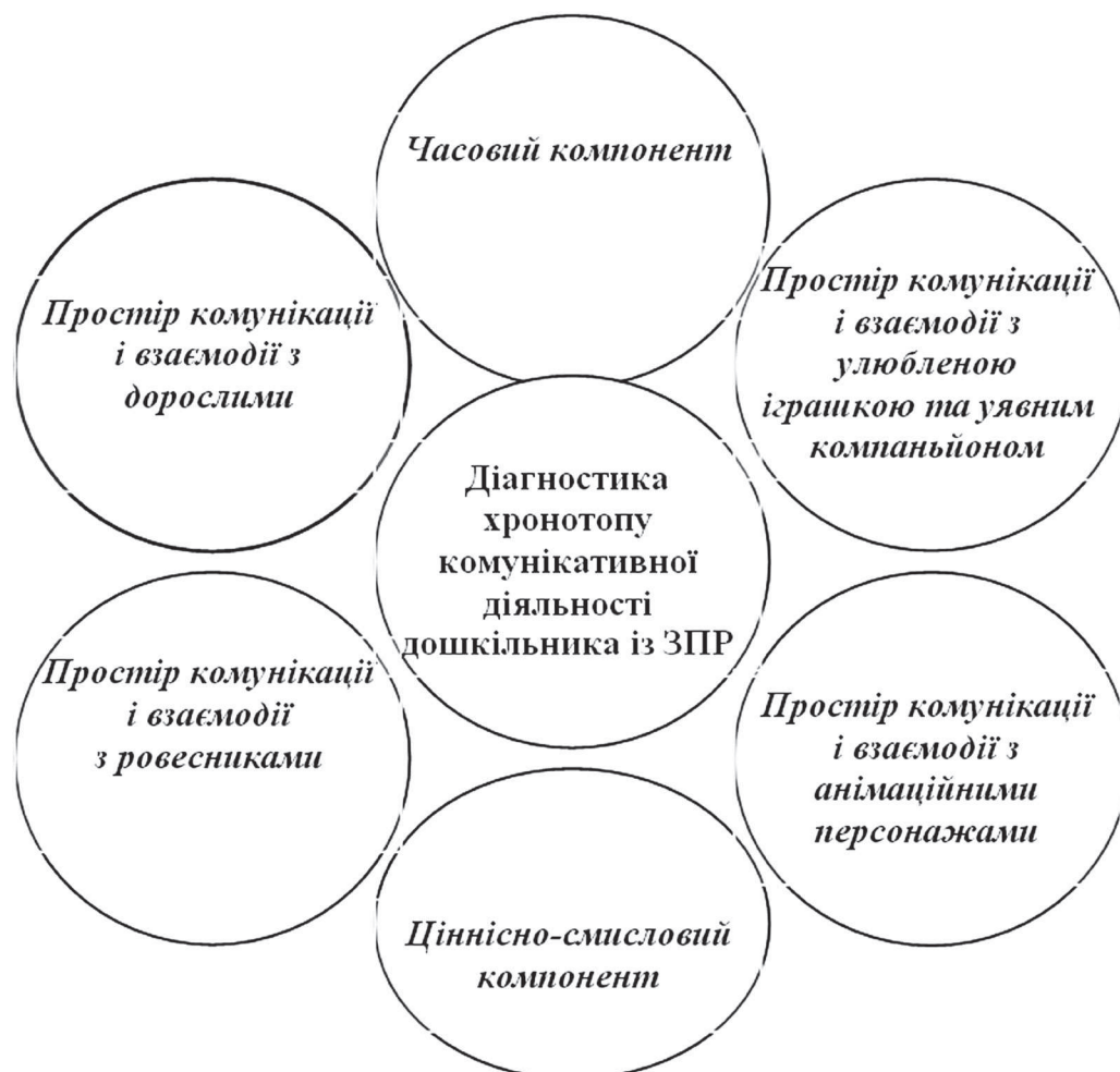
Мал. 1. Система діагностики хронотопу комунікативної діяльності дошкільника із ЗПР

Просторовий параметр комунікації і взаємодії дошкільників із ЗПР із ровесниками вивчається за допомогою методик: суб'єктивної оцінки міжособистісних відносин