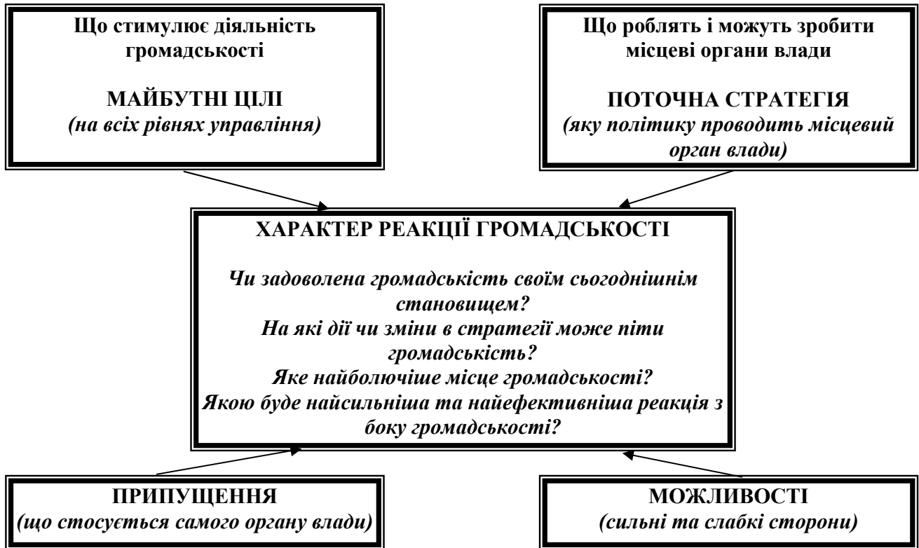
Рис. 2. Компоненти, які впливають на реакцію громадянськості

Разом із прогнозуванням перспектив органів місцевої влади стосовно подальшого розвитку підпорядкованих їм територій важливе значення має поетапне прогнозування окремих проблем: майбутнє науки, техніки, технологій, соціально-трудова сфера як головної продуктивної сили суспільства, засобів праці, соціально-психологічних відносин та ряду інших чинників.