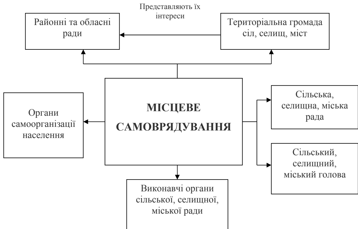
Рис. 1. Місце виконавчих органів місцевих рад у системі місцевого самоврядування

Загалом, під виконавчим органом місцевої ради необхідно розуміти відносно відокремлену частину ради, яку складає колектив громадян, що здійснює виконавчо-розпорядчі функції на підставі владних повноважень і діє за допомогою визначених форм організації та методів діяльності.