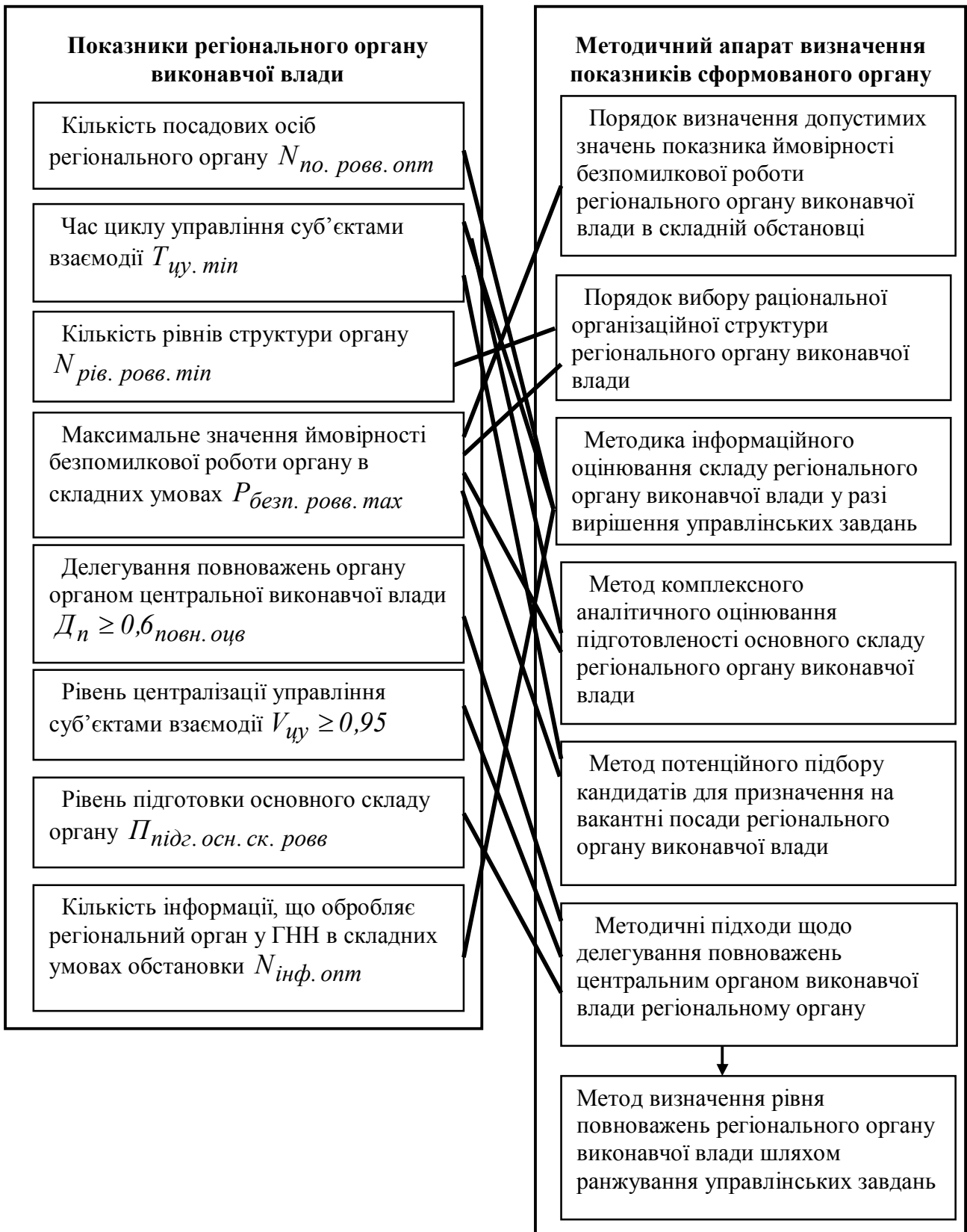
Рис. 2. Загальна схема комплексного визначення показників регіонального органу виконавчої влади