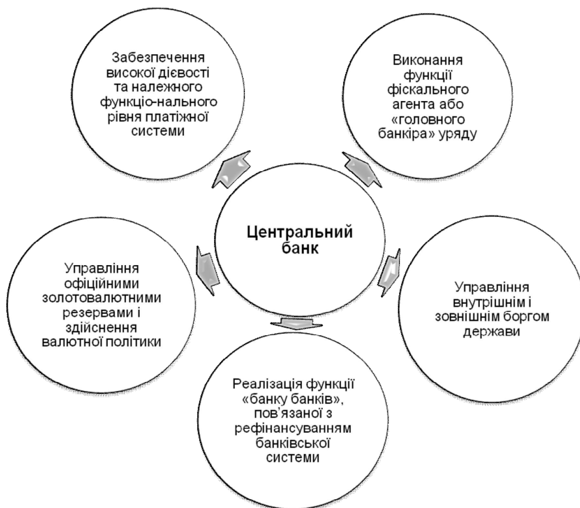
Рис. 4. Функції центрального банку

Головною функцією центрального банку в ринковій економіці є забезпечення грошової стабілізації. Функції центрального банку показано на рис. 4.