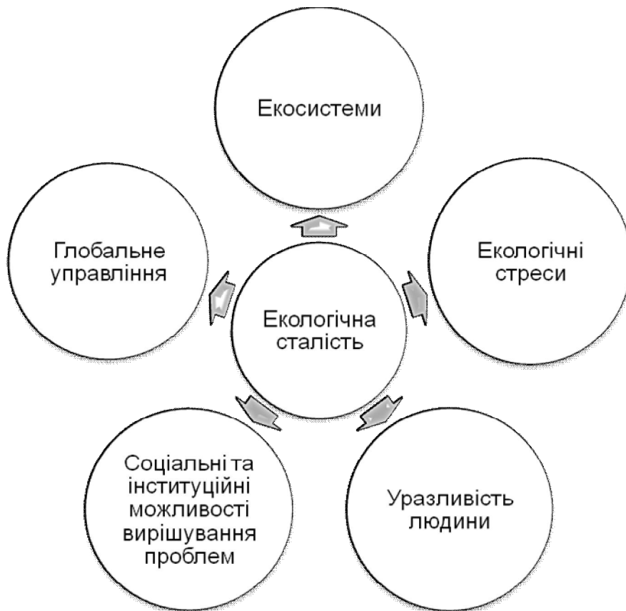
Рис. 2. Головні складові екологічної сталості

Стратегічними пріоритетами політики сталого розвитку є: