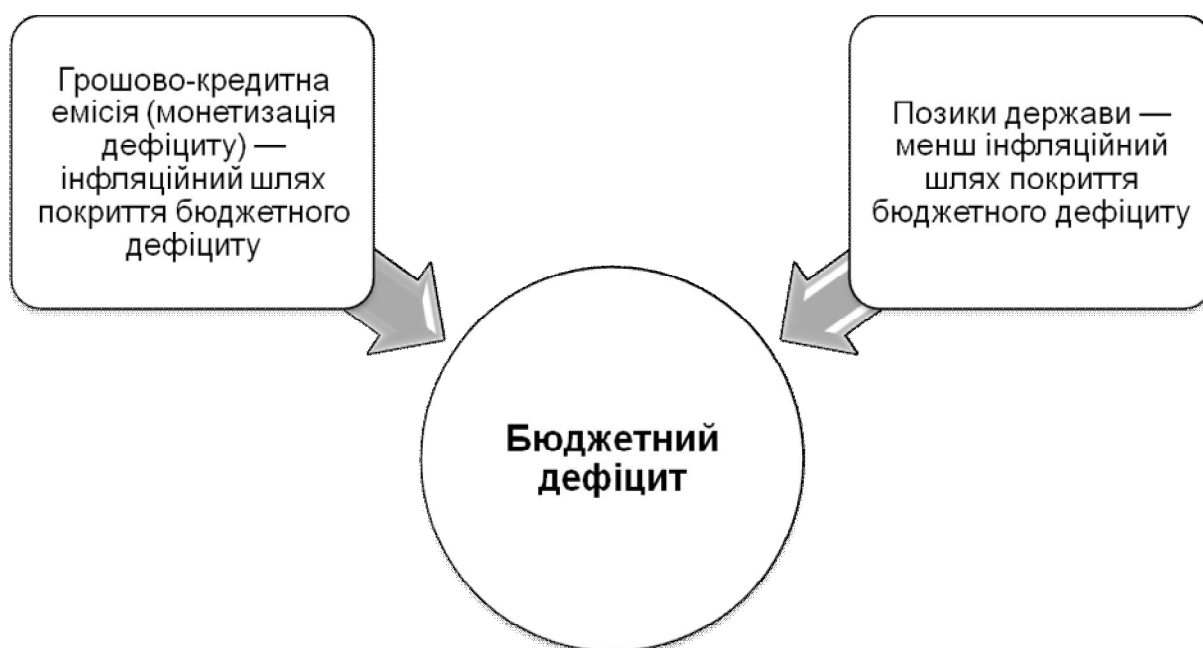
Рис. 1. Джерела фінансування дефіциту бюджету

Дефіцит бюджету означає перевищення видатків над доходами, характеризує його незбалансованість і виникає на основі дії різних чинників – як об'єктивних, так і суб'єктивних. Джерела покриття бюджетного дефіциту зображено на рис. 1.