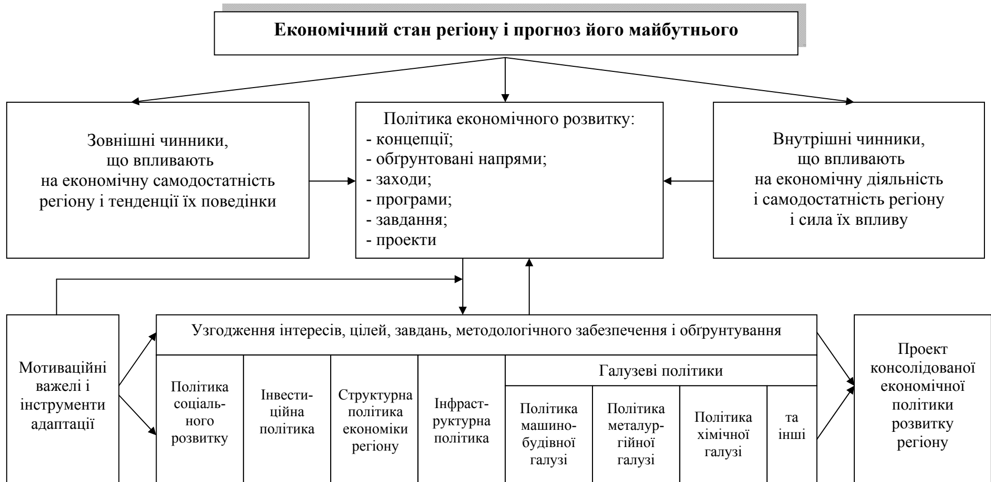
Рис. 2. Модель імплементації інтеграції економічних складових політик різних сфер діяльності регіону в єдину консолідовану політику економічного розвитку