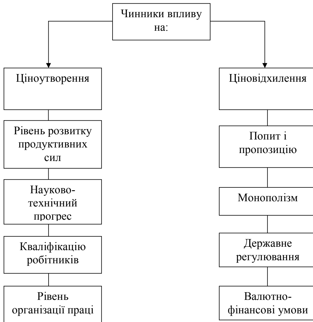
Рис. 3. Чинники, що впливають на рівень цін

Таким чином, формуючи ціну землі, необхідно враховувати всі теоретичні надбання у цій сфері, функції та чинники що впливають на ціну. Як було підмічено, шляхи впровадження реформаційно-трансформаційних змін у сфері використання земельних ресурсів повинні передбачати: