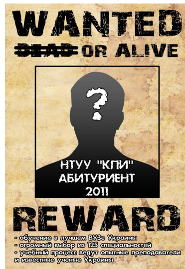
Рис. 4. Конкурсні роботи на тему “Вибирай КПІ!”