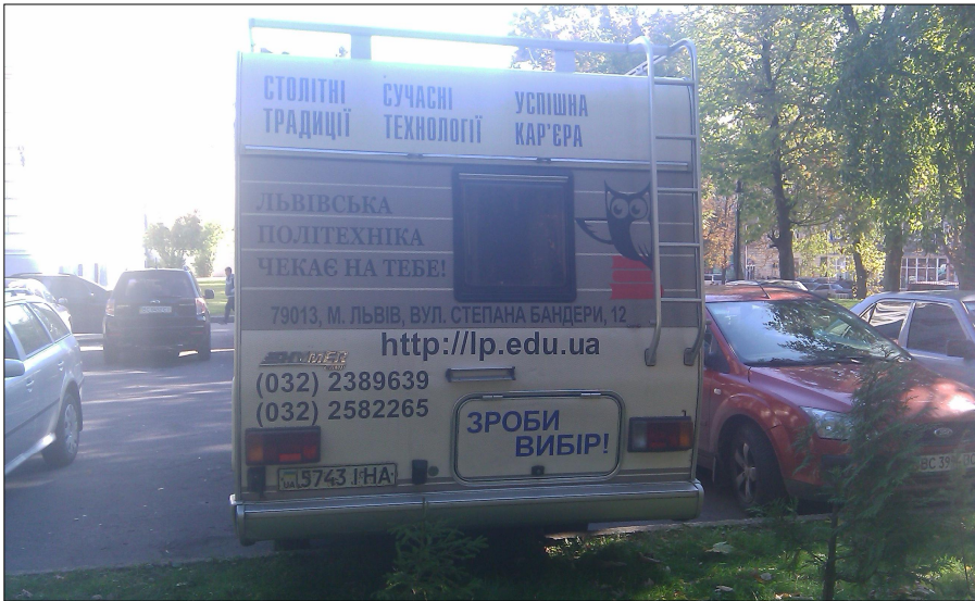
Рис. 3. Автомобіль Інтелектуального навчально-наукового центру професійно-кар'єрної орієнтації НУ "Львівська політехніка" (вид ззаду)

Як видно з рис. 1 – 3, телефонів, за якими можна отримати інформації, є 5, до того ж на різних сторонах кемпінгу розміщені різні телефони. Присутні дві різні адреси сайту та дві абсолютно різні поштові адреси.