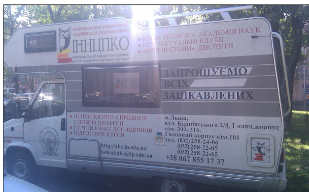
Рис. 1. Автомобіль Інтелектуального навчально-наукового центру професійно-кар’єрної орієнтації НУ “Львівська політехніка” (вигляд з правого боку)

При брендванні службових автомобілів нанесення інформації та логотипів здійснюється в хаотичному порядку за принципом “чим більше інформації та зображень, тим краще”, після чого зовнішній вигляд автомобіля більше нагадує розважальний або цирковий вагончик, ніж іміджеве представлення та рекламоносій навчального закладу. Прикладом такого невдалого використання брендвання може бути автомобіль типу “кемпінг”, що належить Інтелектуальному навчально-науковому центру професійно-кар’єрної орієнтації НУ “Львівська політехніка” (рис. 1 – 3).