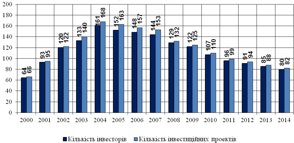
Рис. 1. Кількість інвесторів та інвестиційних проектів на територіях спеціальних економічних зон в Україні у 2000 – 2014 рр. [19]

втратили довіру до вітчизняної влади. Відновлення пільг у спеціальних економічних зонах так і не відбулося.