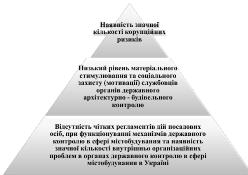
Рис. 2. Схема основних проблем за рівнем масштабності та загроз для ефективного державного контролю у сфері містобудування

актуальною та породжує більшість організаційних проблем, на нашу думку, є проблема низького рівня мотивації службовців органів ДАБК, неналежний стан технічного забезпечення та відсутність чітких регламентів дій посадових осіб під час функціонування механізмів державного архітектурно-будівельного контролю. Організаційні проблеми потребують розв'язання шляхом розробки та впровадження стратегії розвитку системи державного контролю у сфері містобудування в Україні. Правові проблеми потребують поліпшення шляхом внесення змін до існуючих та розробки і впровадження нових нормативно-правових актів, спрямованих на розв'язання означених проблем.