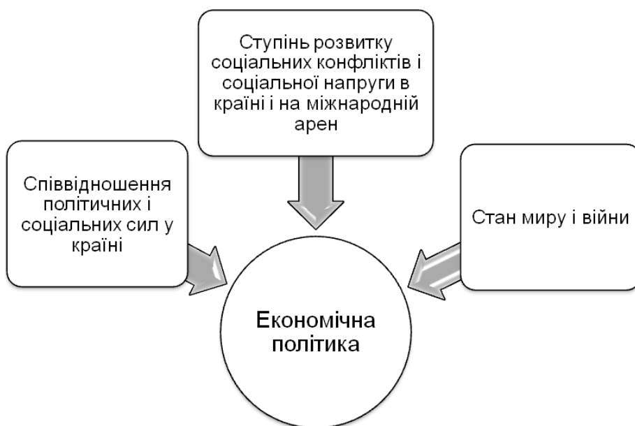
Рис. 1. Вплив факторів на економічну політику

Фактори, які справляють вплив на проведення економічної політики, зображено на рис. 1.