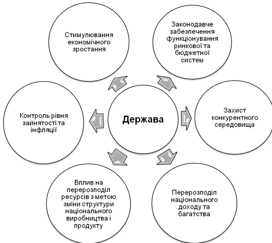
Рис. 2. Головні економічні функції держави