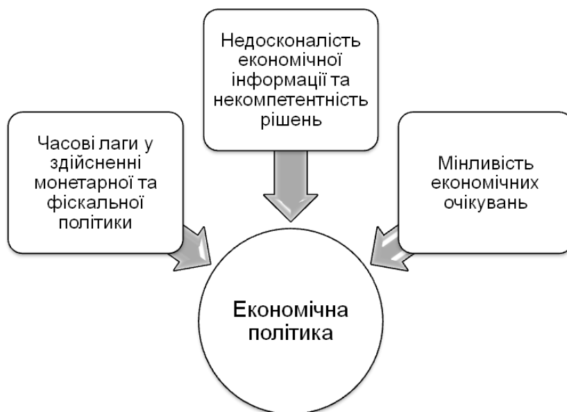
Рис. 5. Проблеми, які можуть вплинути на ефективність проведення своєчасної політики щодо стабілізації економіки

Водночас проведення ефективної економічної політики ускладнюється низкою чинників як об'єктивного, так і суб'єктивного характеру (рис. 5).