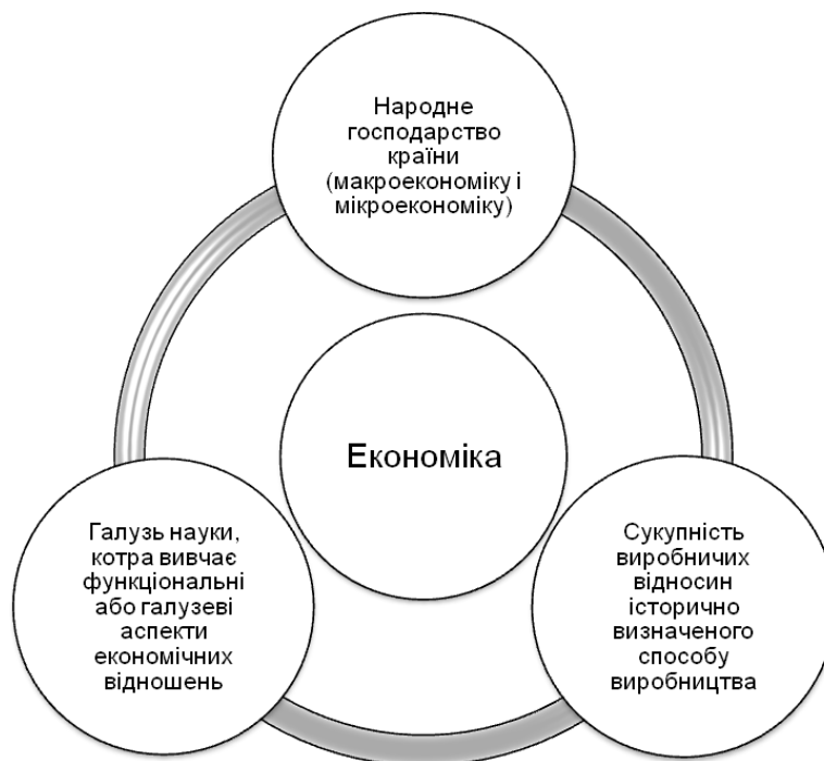
Рис. 3. Основні аспекти економіки

Теоретичні засади державного регулювання ринкового господарства були закладені відомим англійським економістом Дж.М.Кейнсом. Центральне місце в теорії кейнсіанства займає ідея щодо того, що ринкова система саморегулювання