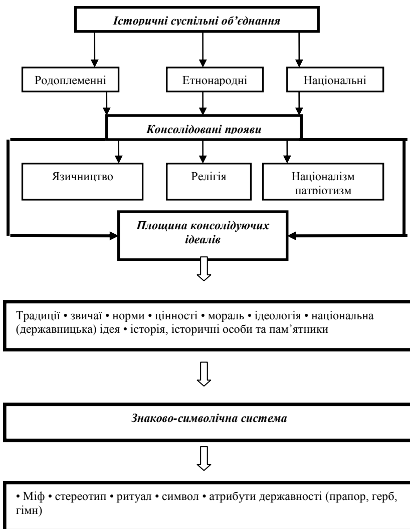
Рис. 1. Чинники національної спільноти

Узагальнюючи досвід зарубіжних та вітчизняних фахівців з досліджуваної проблеми, нами виокремлено чинники національної спільноти через історичні форми суспільного об'єднання. Наше бачення характерних структурних особливостей цього процесу відображає рис. 1.