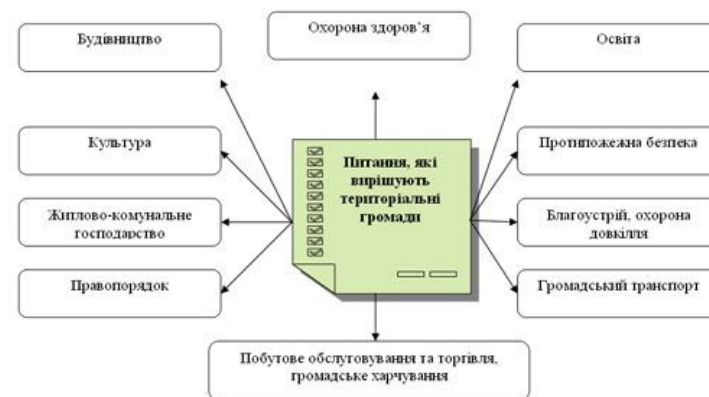
Рис. 2. Питання, віднесені до відання місцевого самоврядування

Як зазначалося вище, органи місцевого самоврядування, особливо їх виконавчі органи (виконавчі комітети сільських, селищних і міських рад) реалізують державну політику охорони здоров'я в межах своїх повноважень, передбачених законодавством [19, ст. 14].