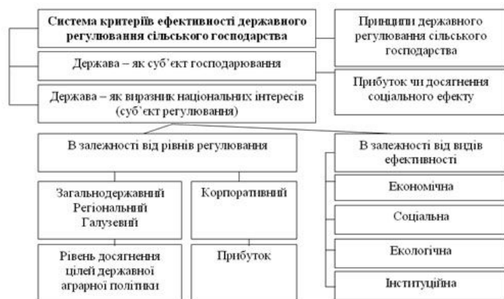
Рис. 1. Система критеріїв державного регулювання сільськогосподарського господарства України

Здійснюючи оцінку ефективності державного регулювання аграрного сектору економіки необхідно, з одного боку, розглядати державу як „...виразника національних інтересів, регулятора соціально-економічних процесів і органу, що впливає на умови функціонування суб'єктів ринку; а з іншого боку – як крупного власника і суб'єкта ринку. В обох випадках критерії оцінки державного регулювання будуть різними.” [5, с.29].