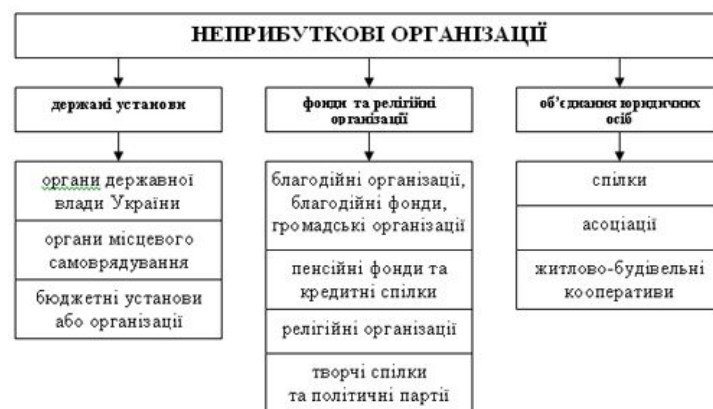
Рис. 1. Неприбуткові організації

7. Участь у виробленні політики, прийнятті рішень та їх реалізації. НПО є каналами представлення існуючих у суспільстві різноманітних інтересів, через які громадяни одержують інформацію і виражають свою думку з приводу планованих рішень.