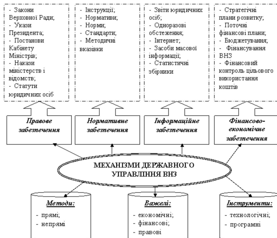
Рис. 3 Структура механізму державного управління ВНЗ системи МОНУ

Для визначення механізмів державного управління вищих навчальних закладів системи Міністерства освіти і науки України (далі – МОНУ) в умовах інтеграції до європейського освітнього простору розглянемо їх основоположні складові (рис. 3).