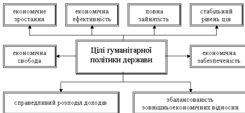
Рис. 1 Цілі гуманітарної політики держави

Результати. Одною зі складових загальнодержавної економічної політики є гуманітарна політика держави, яка саме й визначає принципи державного управління освітньою діяльністю. В економічно розвинутих країнах класичний набір цілей такої політики передбачає наступні напрями (рис. 1).