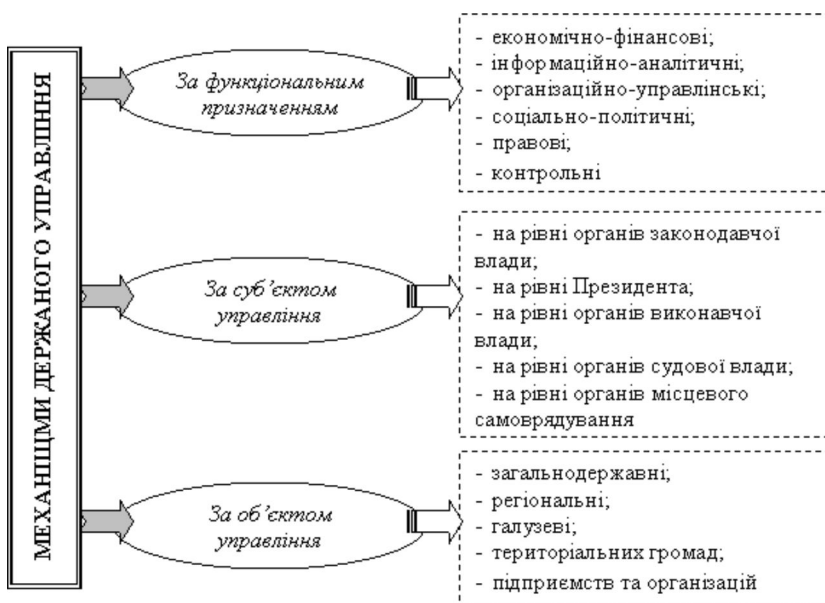
Рис. 2 Класифікація механізмів державного управління

Зазначимо, що залежно від суб'єктів управління на відповідних рівнях відбувається й поділ об'єктів управління. Тож, на нашу думку, узагальнену класифікацію механізмів державного управління доцільно розглядати за функціональним призначенням, за суб'єктами та об'єктами управління (рис. 2).