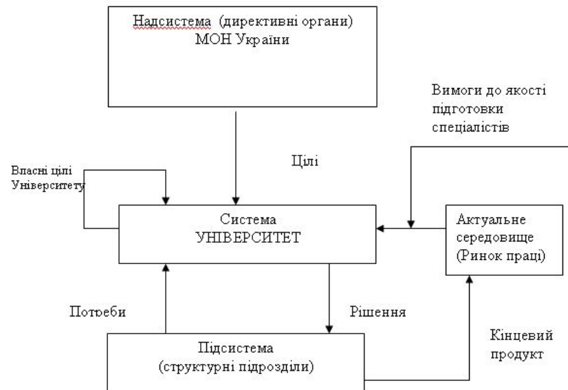
Рис.1.2. Склад цілепокладаючих систем

В університеті, де існує декілька рівнів управління, складається ієрархія цілей, яка являє собою декомпозицію цілей більш високого рівня в цілі більш низького рівня, які виступають засобами для досягнення цілей більш високого рівня. Концептуальним є питання визначення цілей освітньої системи (рис.1.2). Тут можливі різні підходи з боку держави, суспільства, громадськості та різних організацій.