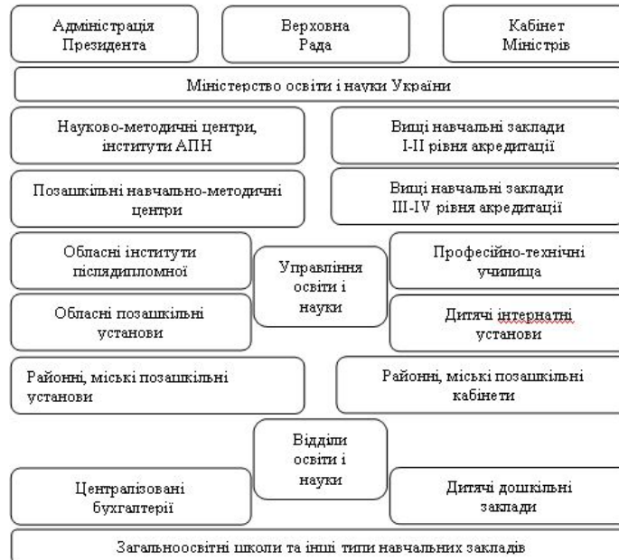
Рис.1.3. Система державного управління національною освітою України

Національне освітнє законодавство спирається на Конституцію України. Воно регулює питання професійної підготовки, нормативні акти для освітніх закладів, діяльність приватної освіти, програму Міністерства освіти і науки, бюджет освітньої системи. Нарешті, ці складові визначають кого, як і навіщо навчати.