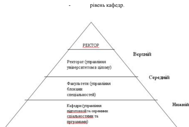
Рис.1.3. Рівні управління освітньою діяльністю університету

Ректор університету в межах наданих йому повноважень: