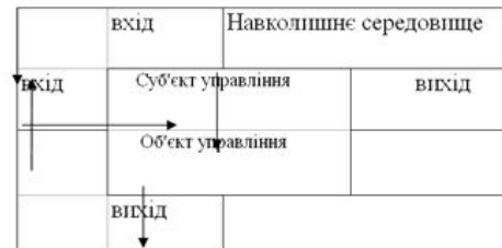
Рис. 6. Принципова схема управління

Взаємодію цих підсистем подано на схемі (рис. 6).