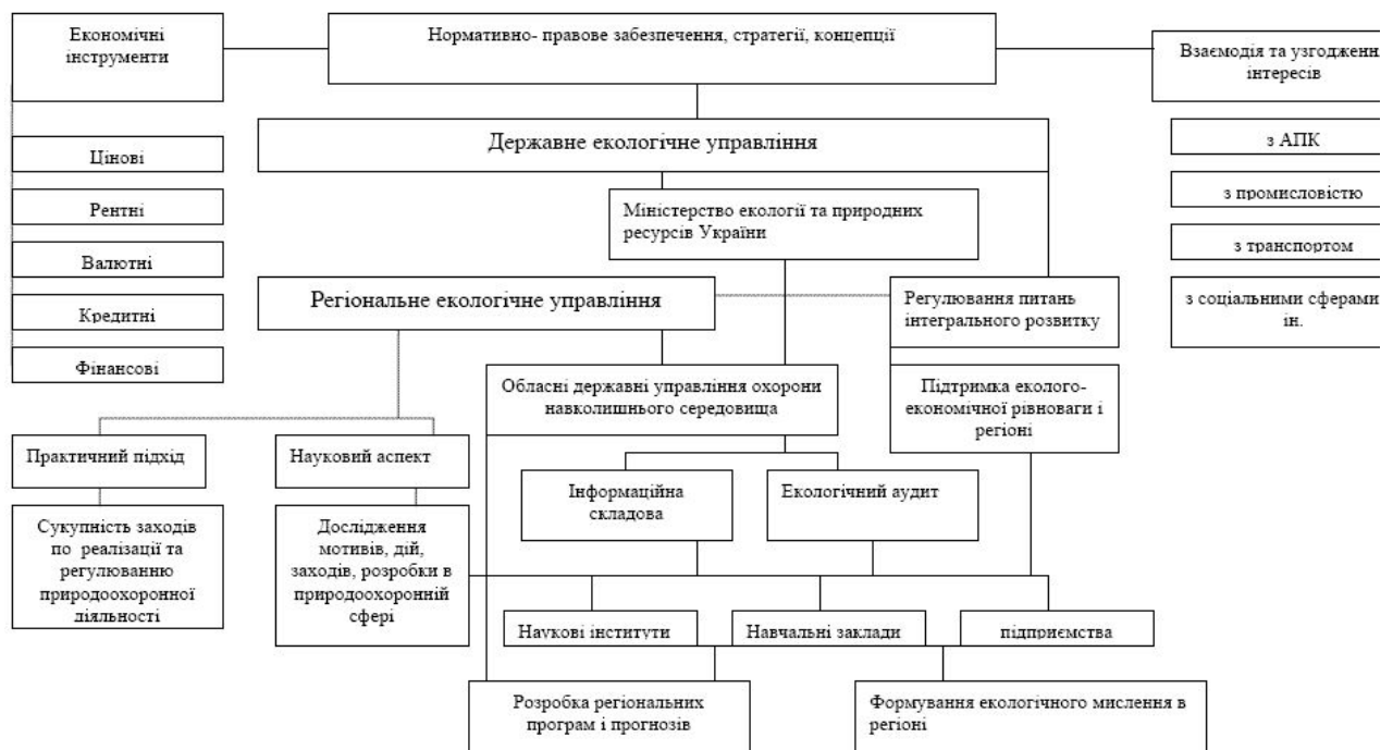
Рис. 2. Державне стратегічне управління розвитком регіону на основі концепції екологічного менеджменту

1) при забезпеченні сталого економічного зростання, який передбачає поліпшення соціальних умов життєдіяльності суспільства при рівноважному природокористуванні. При цьому кожна складова сталого розвитку характеризує різні сторони розвитку суспільства: економічну, екологічну і соціальну;