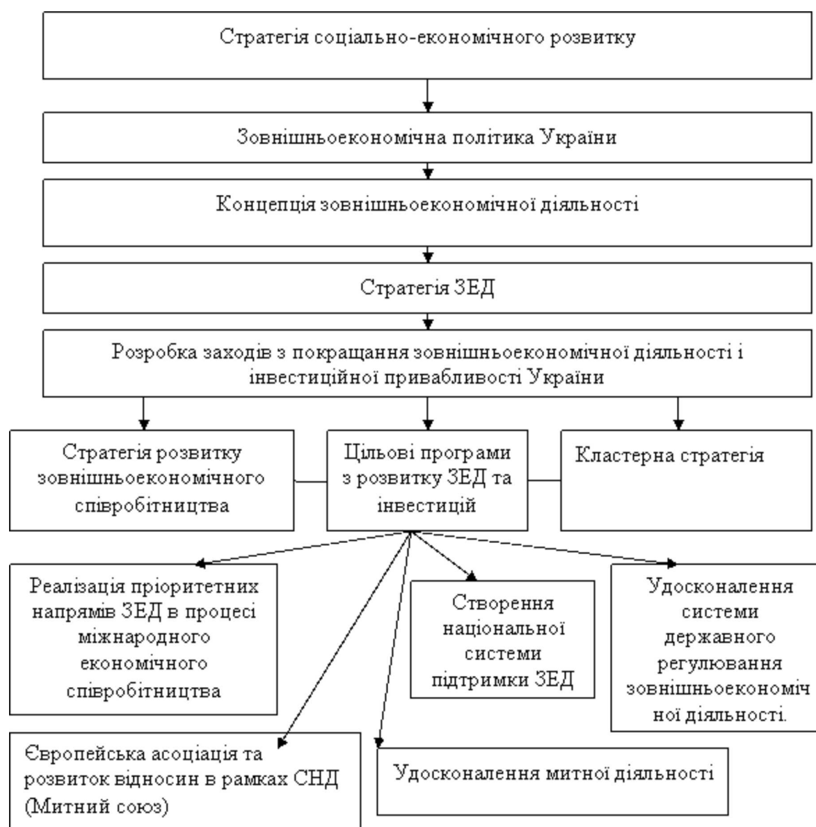
Рис. 2. Схема розробки заходів щодо вдосконалення зовнішньоекономічної діяльності

Координація діяльності кластерів у сфері інноваційного розвитку повинна доповнюватись технологічними платформами, сформованими в цілях ефективної взаємодії науково-технічного сектору та бізнесу. Кластерний підхід, націлений також на підвищення конкурентоспроможності і є одним із пріоритетних методів реалізації економічної політики. Необхідною умовою розвитку кластерних структур є наявність стратегії, реалізація якої сприяє придбання і впровадженню критичних технологій, новітнього обладнання, отримання підприємствами кластера доступу до сучасних методів управління та спеціальних знань; ефективних можливостей виходу на високо конкурентні міжнародні ринки.