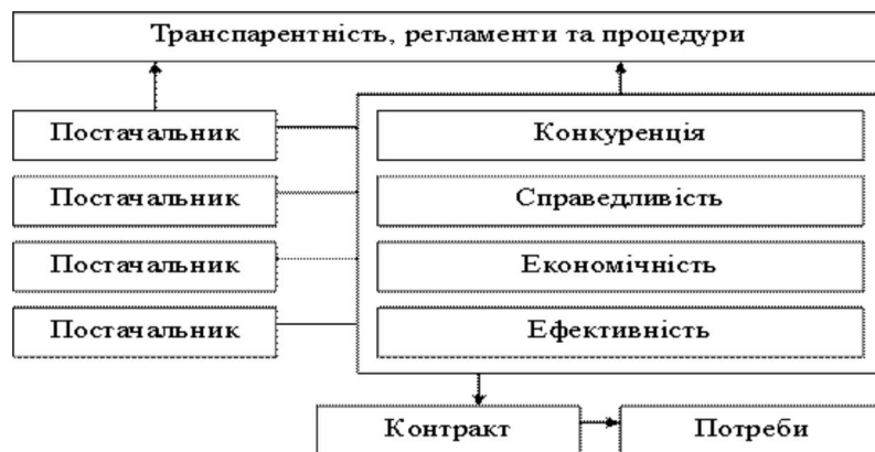
Рис. 1. Основні принципи прок’юременту

Організація державою системи розміщення замовлення (для державних, регіональних, корпоративних потреб) повинна бути пов’язана з принципами прок’юременту (англ. – procurement). Загальноприйняті принципи прок’юременту встановлені такими міжнародними документами, як, Угода про державні закупівлі в рамках Всесвітньої торгової організації, документами та директивами країн-учасниць ЄС (рис. 1).