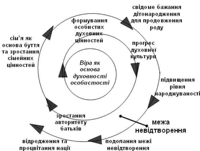
Рис. 3. Демографічна духовно-культурна прогресивна спіраль

3. Демографічна побутово-фізіологічна деградаційна спіраль (ДПФДС) (рис. 4.) відображає негативні побутово-фізіологічні процеси, які впливають на зниження народжуваності та наближують населення України до «межі невідтворення».