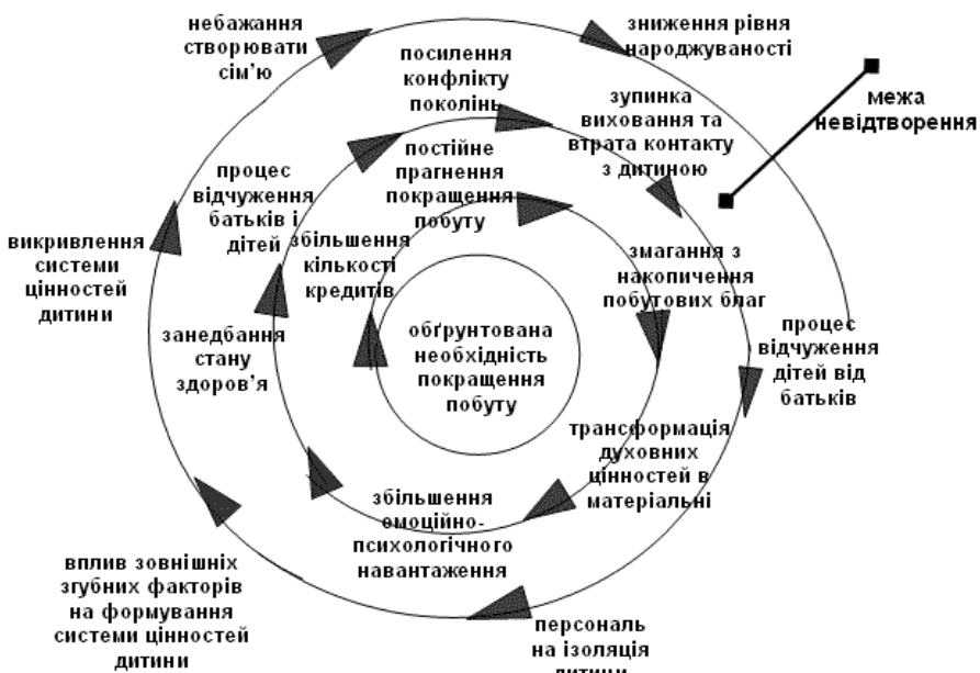
Рис. 4 Демографічна побутово-фізіологічна деградаційна спіраль

Проаналізувавши три основні складові спіралі ДДС, можна виділити основні принципи функціонування ДДС: