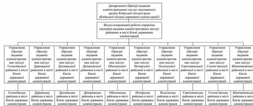
Рис. 2. Схема управління системою надання адміністративних послуг у місті Києві

У вирішенні питання інституційного становлення системи управління сферою надання адміністративних послуг найбільш ефективною є наступна схема (Рис.2):