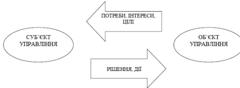
Рис. 2. Модель кумулятивності соціального механізму формування і реалізації державного управління

Грунтуючись на позиції дослідників, зроблено опис соціального механізму формування і реалізації державного управління у моделі кумулятивності (рис. 1.2). В основу останньої покладено потреби, інтереси, цілі об'єктів управління та рішення і дії суб'єктів управління, які впливають на побудову взаємовідносин влади з громадськістю.