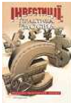
Журнал «Інвестиції: практика та досвід»