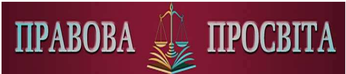
Електронне видання «Правова просвіта»