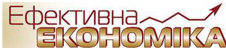
Електронне видання «Ефективна економіка»