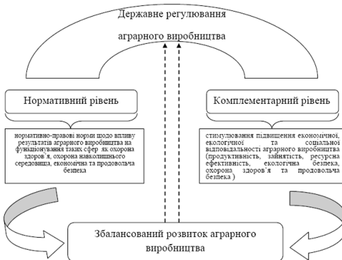
Рис. 1. Графічна інтерпретація впливу рівнів державного регулювання на розвиток аграрного виробництва

У ході дослідження нами доповнено загальноприйнятий підхід щодо рівнів впливу держави на аграрне виробництво нормативним та комплементарним (рис.1).