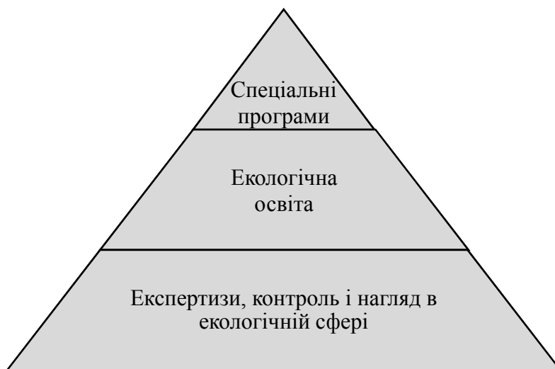
Рис. 3. Заходи держави щодо забезпечення прав громадян України на безпечне довкілля

До структури державних заходів, що спрямовані на забезпечення прав громадян України на безпечне довкілля входять наступні елементи (рис. 3).