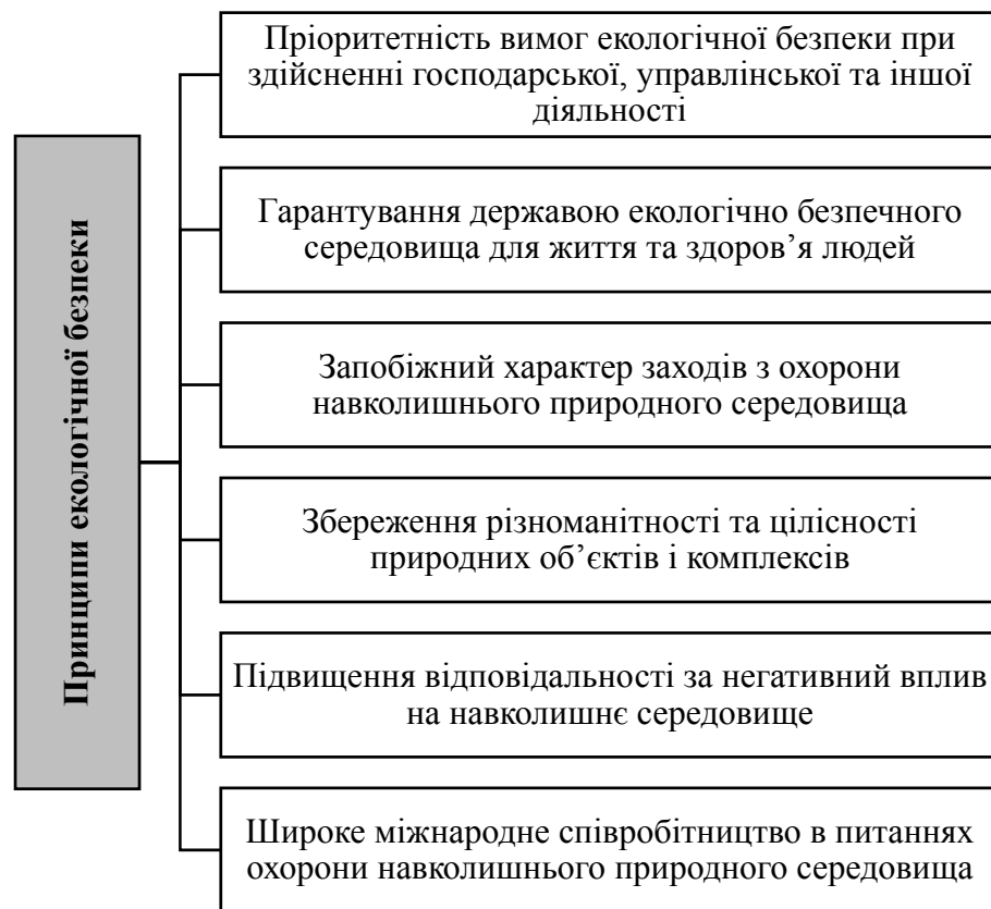
Рис. 1. Принципи екологічної безпеки

Державне регулювання охорони вітчизняної екологічної сфери здійснюється за допомогою комплексу заходів правового, адміністративного та економічного характеру, які в сукупності формують екологічну політику держави, і, відповідно, визначають важелі державного регулювання природоохоронної діяльності.