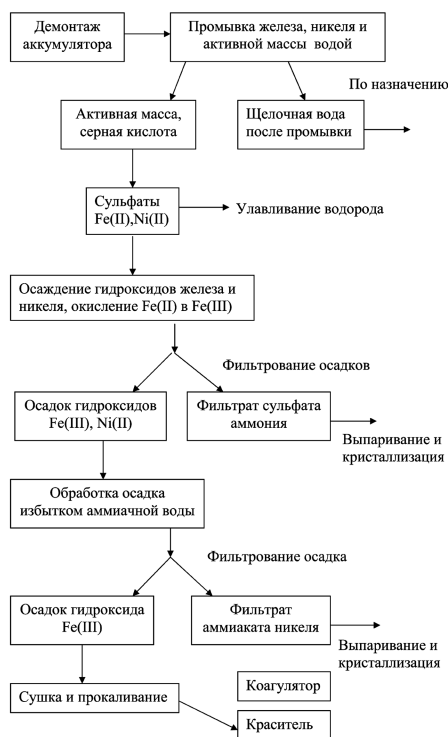
Рис.1. Схема утилизации отработанных железо-никелевых аккумуляторов.

Кислый раствор, содержащий сульфаты никеля (II) и железа (II), подают насосом 8 в емкость 9, откуда кислый раствор через мерник 10 поступает в реактор 11, оборудованный мешалкой с электроприводом и барботером для подачи воздуха от компрессора 14. Из емкости 12 через мерник 13 в реактор 11 подают гидроксид аммония, что приводит к осаждению гидроксидов никеля (II) и железа (III). Раствор вместе с осадком из реактора 11 подают на вакуум-фильтр 15.