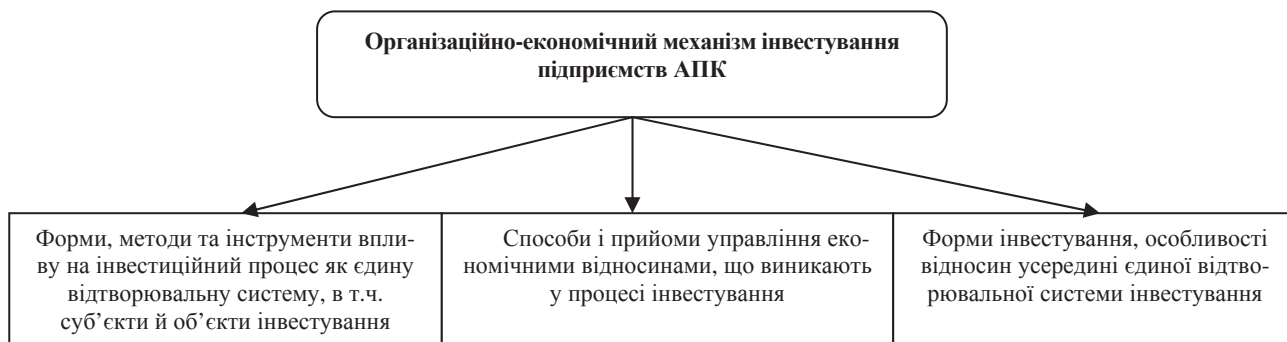
Рис. 1. Організаційно-економічний механізм інвестування підприємств АПК *

Виклад основних результатів дослідження. Організаційно-економічний механізм інвестування як категорія є сукупністю економічних інструментів і методів регулювання, що забезпечують максимальну ефективність використання капіталу за зовнішніх та внутрішніх постійно змінюваних умов інвестиційного ринку [1]. До складу організаційно-економічного механізму інвестування слід включити такі інструменти й методи (рис. 1).