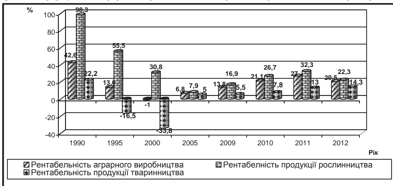
Рис. 1. Динаміка рентабельності сільськогосподарського виробництва, %

Основним показником ефективності діяльності сільськогосподарських підприємств є рентабельність продукції. Сучасний стан аграрних підприємств України характеризується нестабільною динамікою показників рентабельності виробництва (рис. 1). Згідно з аналізом статистичних даних, рентабельність сільськогосподарського виробництва становить 20,5%, що на 22,1 пункта менше, ніж у 1990 році. Зниженням рентабельності характеризується функціонування аграрних підприємств протягом останніх трьох років.