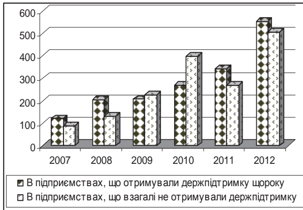
Динаміка орендної плати на 1 га с.-г. угідь, %