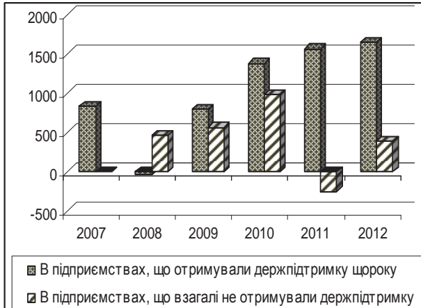
Динаміка прибутку на 1 га с.-г. угідь, грн