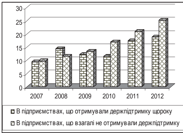
Динаміка річної оплати праці 1 працівника, тис. грн