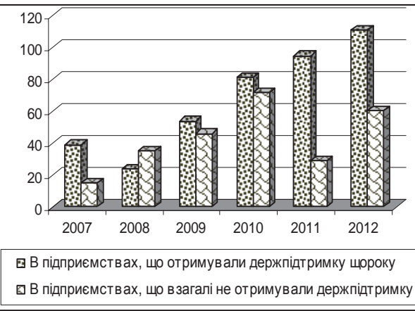
Динаміка чистої продукції на 1 працівника, тис. грн