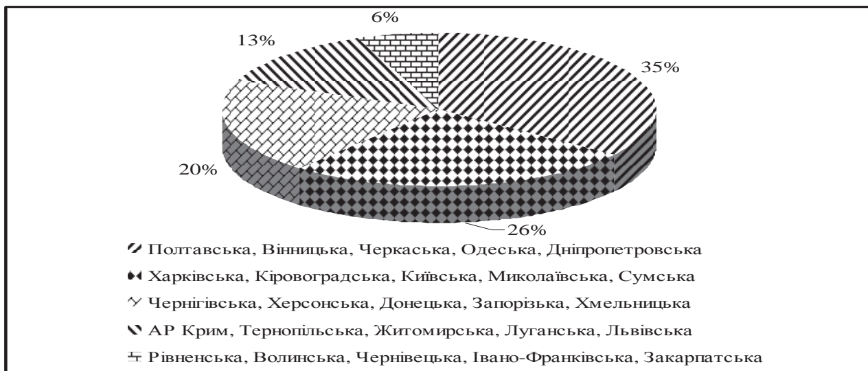
Рис. 2. Структура виробництва зерна за областями в 2009 – 2012 рр.*

*Розраховано автором за даними Державної служби статистики України [7].