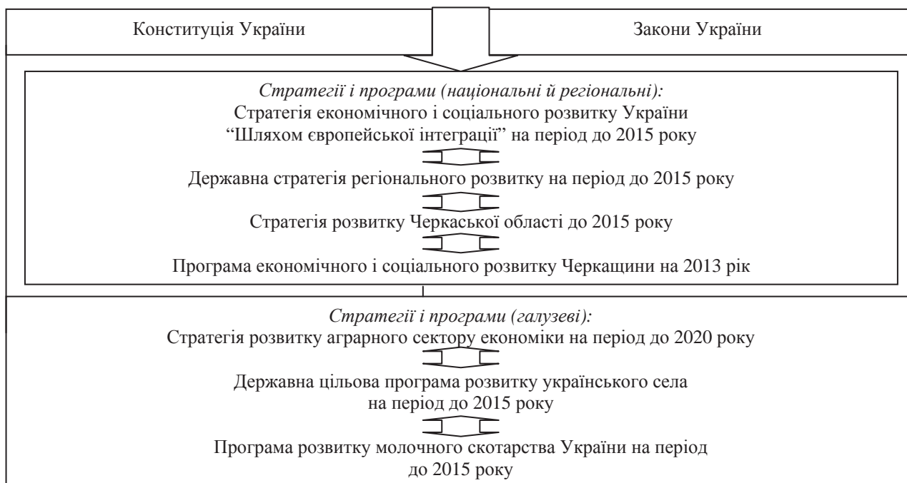
Рис. 1. Правовий простір системування молокопродуктового підкомплексу в контексті забезпечення продовольчої безпеки України

На нашу думку, інвестиційне забезпечення розвитку молокопродуктового підкомплексу можливе лише за умови досягнення відповідної узгодженості вказаних на рисунку 1 стратегій і програм у системі державного регулювання.