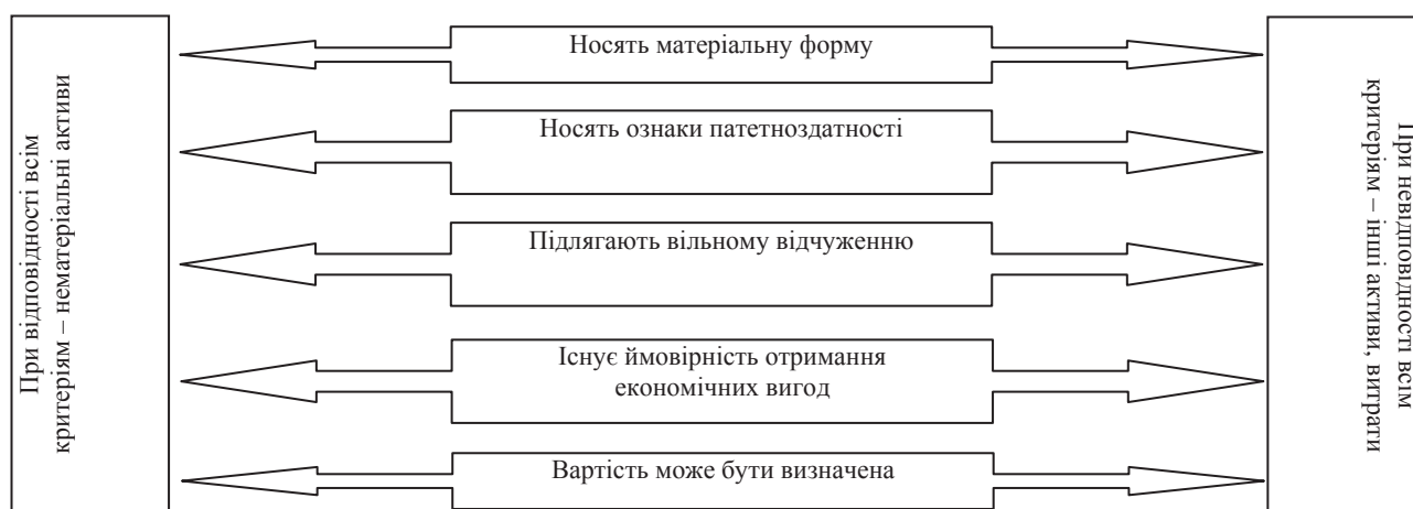
Рис. 3. Спрощений підхід до аналізу відповідності критеріям визнання ОІВ

Аналізу підлягають також правостановлювальні документи на об'єкти інтелектуальної власності. Це свідоцтва на торговельні марки (знаки для товарів і послуг), патенти на сорти рослин (на промислові зразки, на корисні зразки), авторські свідоцтва. При цьому слід пам'ятати про те, що права на ОІВ посвідчуються правостановлювальними документами, виданими Державним департаментом інтелектуальної власності.