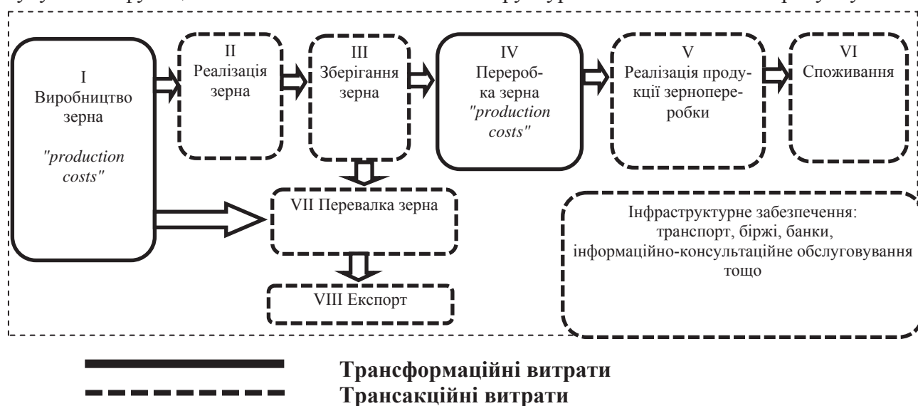
Рис.1. Місце трансформаційних і трансакційних витрат у схематичній інтерпретації логістичної системи в зернопродуктовому підкомплексі АПК

когосподарських і промислових підприємств, які забезпечують формування пропозиції зерна, його первинну обробку, зберігання, переробку на борошно, крупи, комбікорми, а також реалізацію, у тому числі на експорт, через посередню участь відповідних інфраструктурних елементів та є джерелом сировинних ресурсів для підприємств спеціалізованих галузей із виробництва продовольчих товарів. Якщо предметно розглядати зернопродуктовий підкомплекс АПК і його логістичні взаємозв'язки, то розмежування витрат на трансформаційні й трансакційні, згідно з підходом Дж. Уолліса та Д. Норта можна представити у вигляді структурно-логічної схеми на рисунку 1.