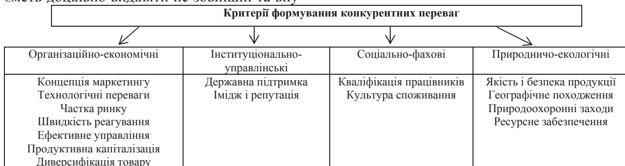
Рис. 1. Критерії формування конкурентних переваг

трішні фактори конкурентоспроможності, а ті, що створюються (керовані) й ті, що враховуються (некеровані) [16]. Система таких факторів наведена на рисунку 2.