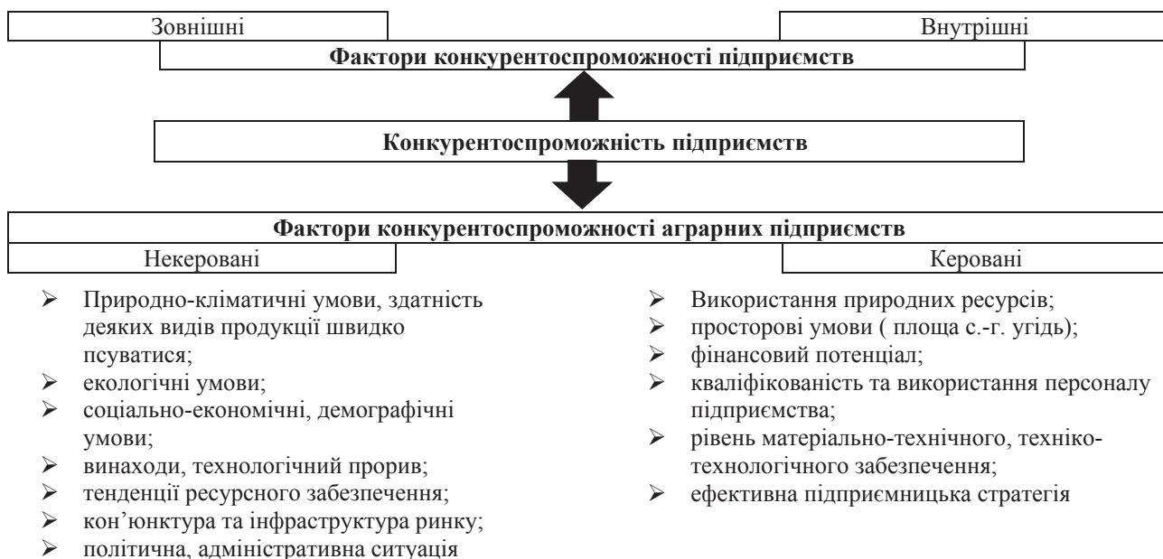
Рис. 2. Система факторів конкурентоспроможності підприємств