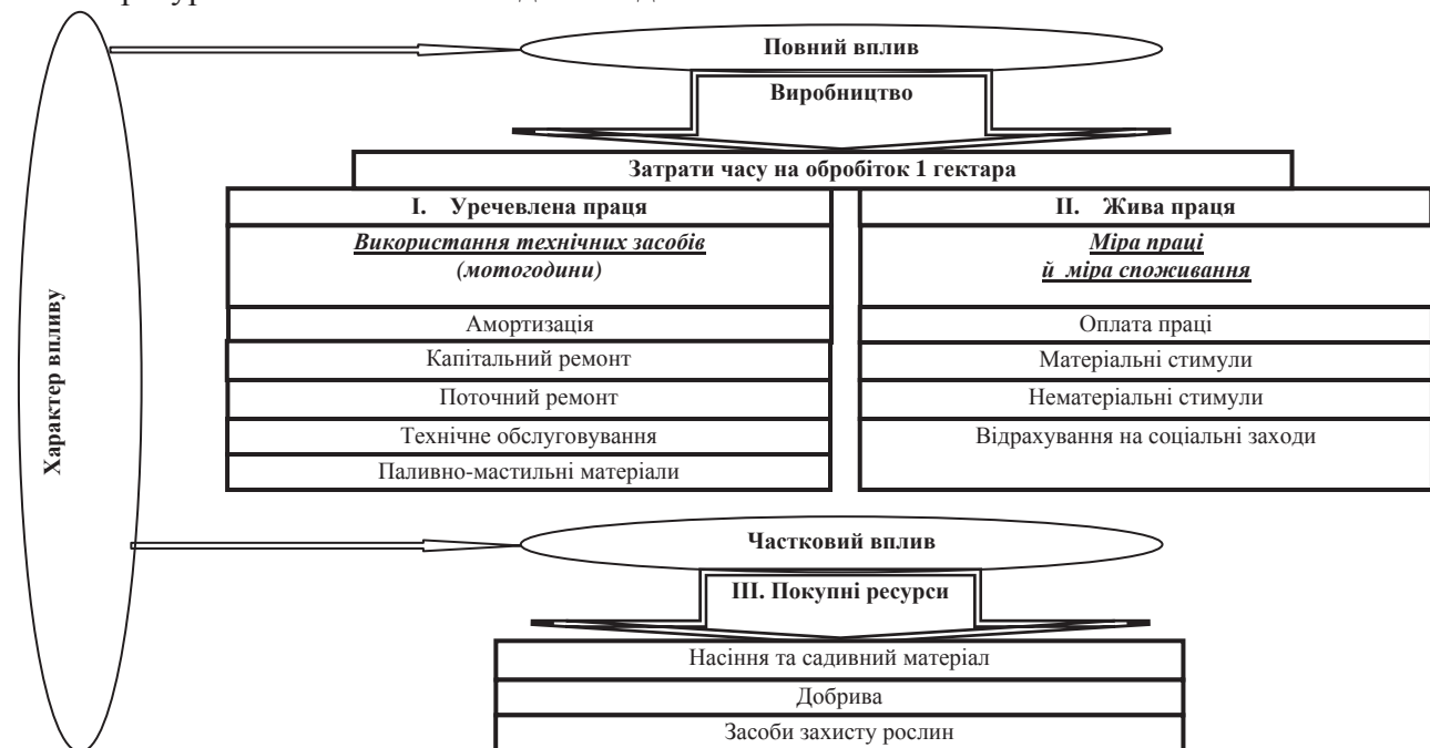
Рис. 1. Групування витрат на виробництво продукції рослинництва залежно від характеру впливу умов виробництва (земельної ренти)

Визначення окремих показників витрат за статтями калькуляції під час виробничого процесу в рослинництві передбачає, передусім, вимір затрат часу на обробіток 1 га площі, за результатами чого є можливість визначити затрати живої й уречевленої праці через рівень мото- та людино-годин. Затрачені мото-години є основою для визначення витрат на амортизацію, поточний і капітальний ремонт, технічне обслуговування машин та агрегатів, пальне тощо. Затрати живої праці, що визначені кількістю людино-годин, людино-днів є основою для розрахунку оплати праці й відрахувань на соцзаходи робітників, рівня матеріального заохочення. Таким чином, затрати на живу та уречевлену працю прямо залежать від природно-виробничих умов, що має кожна окрема ділянка землі (рис. 1).