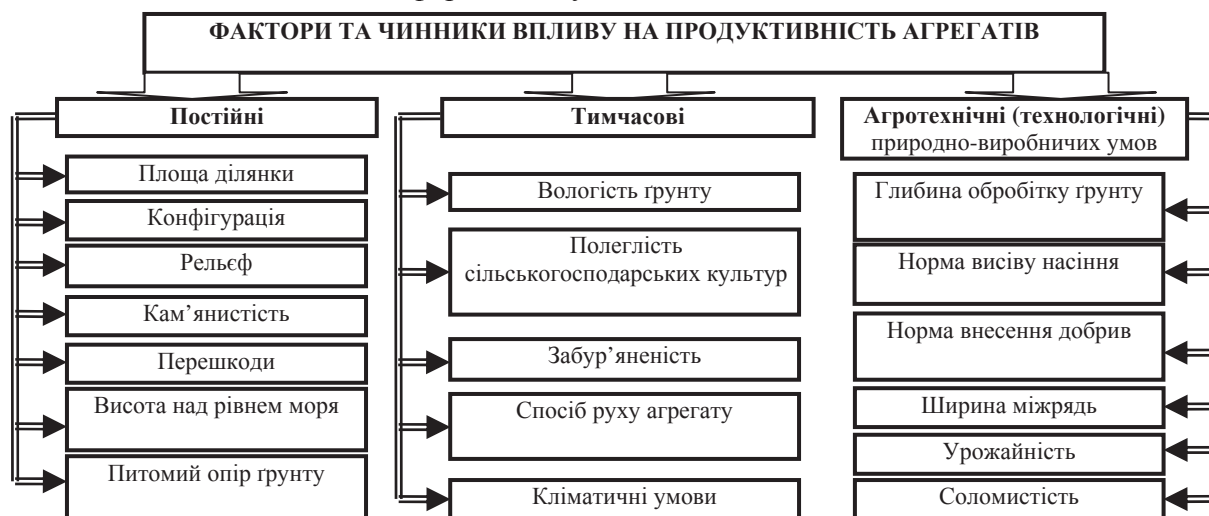
Рис. 2. Фактори та чинники впливу на продуктивність агрегатів

на продуктивність агрегату, що обробляє земельну ділянку, об'єднують у кілька груп: постійні, тимчасові, агротехнічні або технологічні (рис. 2) [2, с. 8].