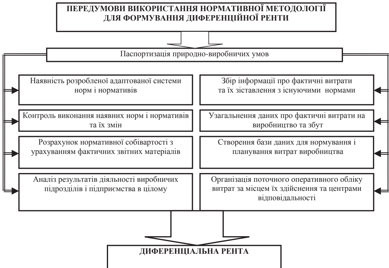
Рис. 3. Передумови використання нормативної методології для формування диференційної ренти