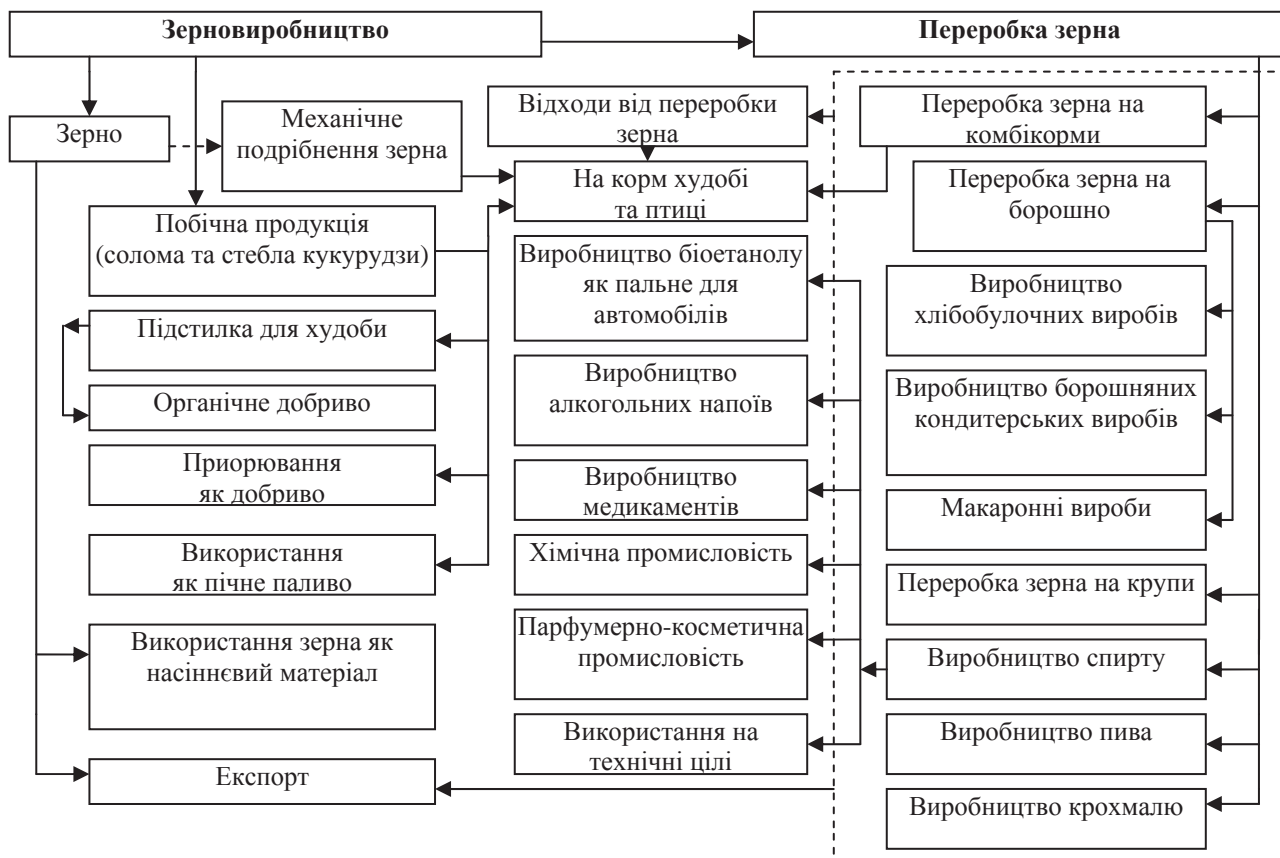
Рис. 2. Основні напрями використання зерна, продуктів його переробки та побічної продукції