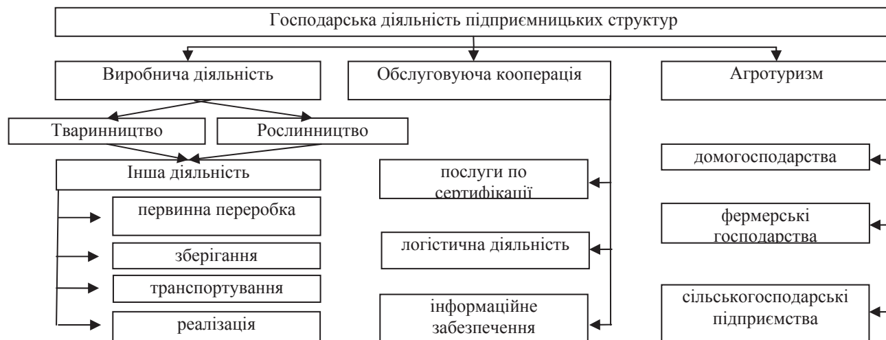
Рис. 2. Стратегічні напрями диверсифікації діяльності підприємницьких структур