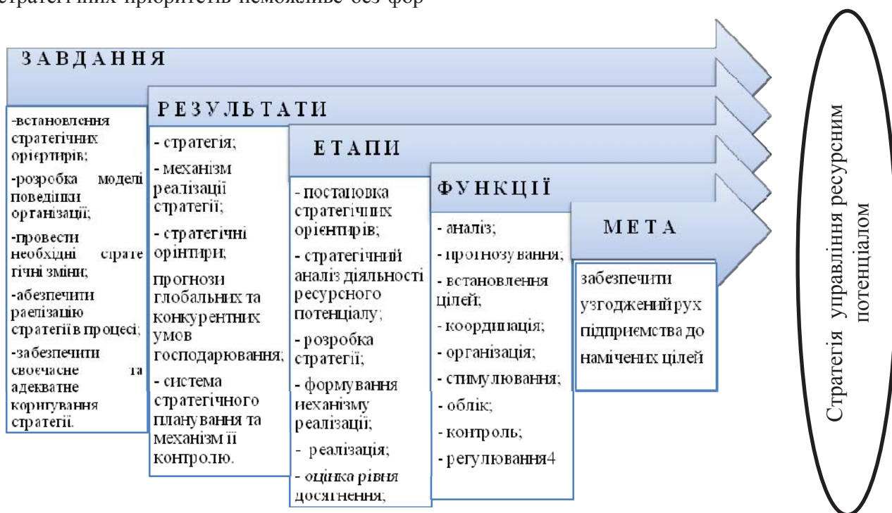
Рис. 1. Елементи стратегічного управління ресурсним потенціалом підприємства

мування елементів стратегічного управління ресурсним потенціалом підприємства (рис. 1).