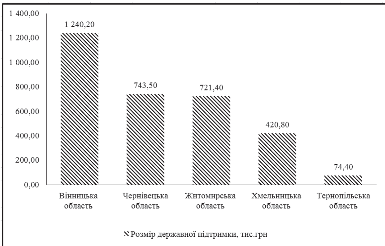
Рис. 3. Надання кредитів фермерським господарствам