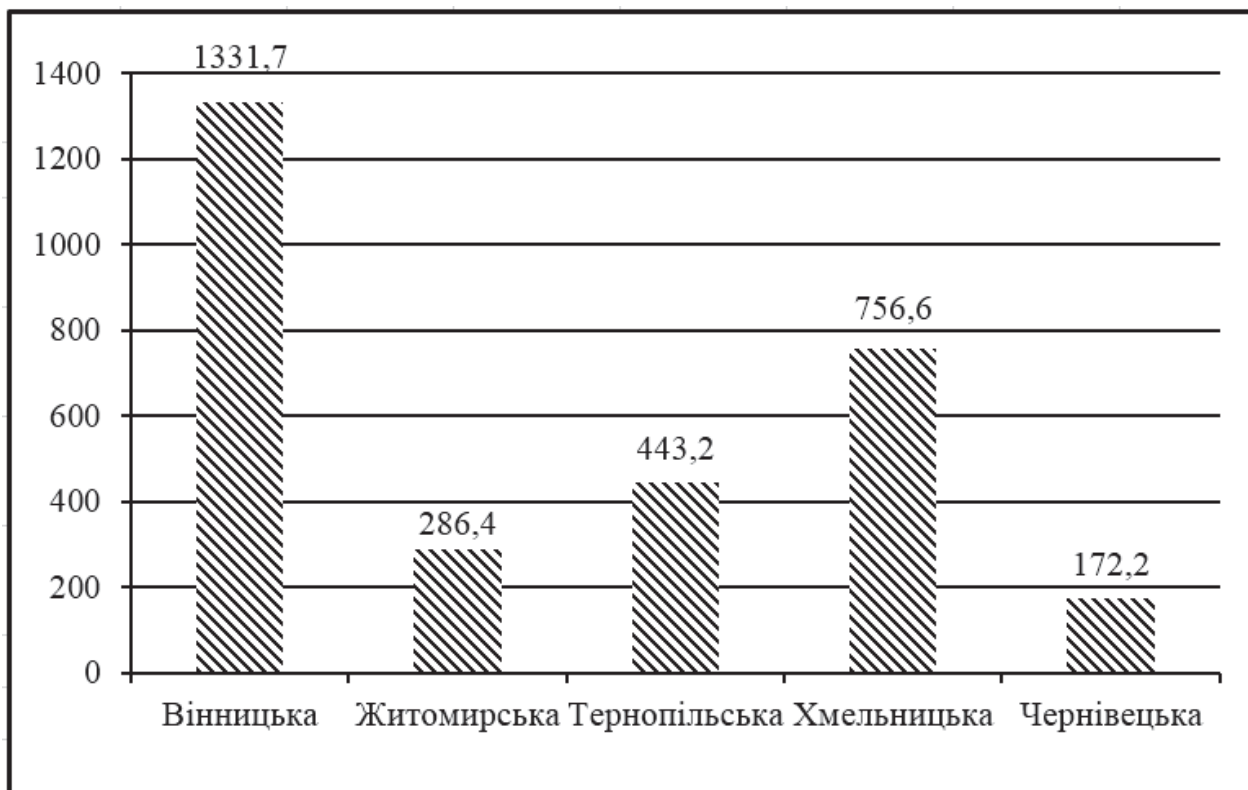
Рис. 1. Обсяг виробництва сільськогосподарської продукції фермерських господарств деяких областей у постійних цінах, млн грн

масштаби реалізації сільгосппродукції порівняно з сусідніми областями (рис. 1).