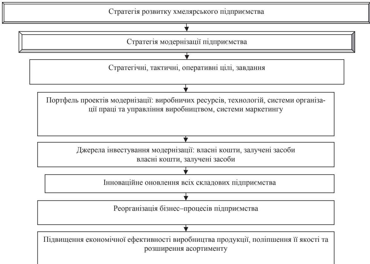
Рис. 1. Концептуальна модель розвитку модернізації хмелярських підприємств