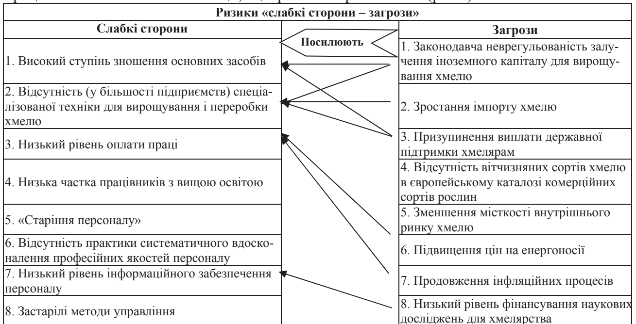
Рис. 5. Ризики розвитку модернізації підприємств галузі хмелярства

Ризики розвитку модернізації підприємств галузі хмелярства, ідентифіковані за результатами аналізу ланцюга «слабкі сторони – загрози», такі. Прогалини у законодавчому регулюванні питань залучення іноземних інвестицій для розвитку виробництва хмелю разом із відсутністю дієвої протекціоністської політики щодо хмелярів, призупиненням виплати їм дотацій є ризиком для підприємств галузі, оскільки дані чинники підсилюються низкою слабких сторін виробників хмелю, зокрема: високим ступенем зношення основних засобів, відсутністю у більшості підприємств спеціалізованої техніки для вирощування та переробки хмелю, внаслідок чого трудомісткість виробництва продукції висока, врожайність хмелю низька, а одержана продукція через високу собівартість має низький рівень конкурентоспроможності (рис.5).