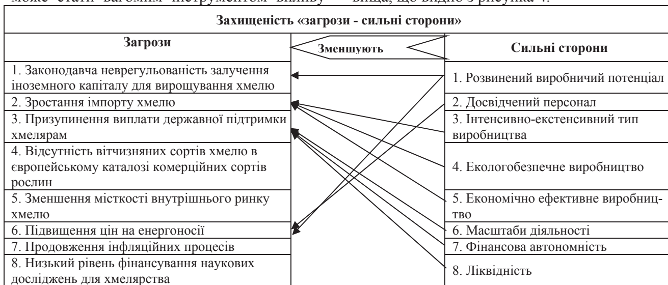
Рис. 4. Захищеність розвитку модернізації підприємств галузі хмелярства

Ступінь захищеності розвитку модернізації підприємств галузі хмелярства, визначений з'ясуванням зв'язків між їх сильними сторонами й загрозами зовнішнього середовища, що видно з рисунка 4.