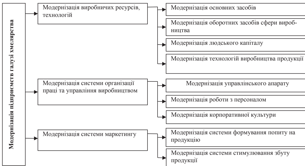
Рис. 6. Стратегічні й тактичні цілі модернізації хмелярських підприємств

Реалізація місії модернізації підприємств галузі хмелярства передбачає досягнення ряду стратегічних і тактичних цілей (рис. 6).