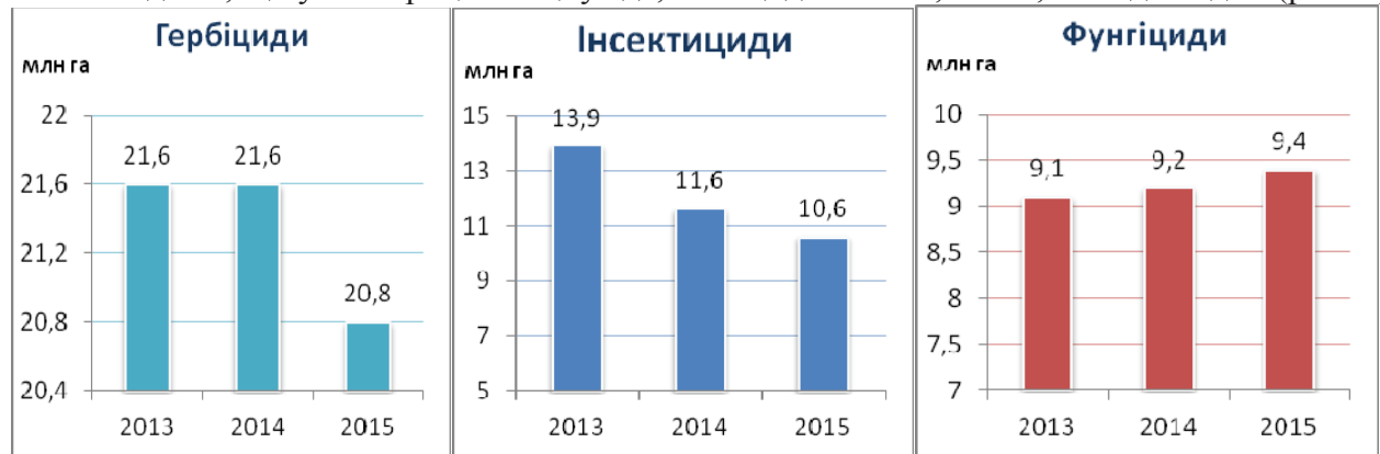
Рис. 2. Площа угідь, оброблена засобами захисту рослин (2013-2015 рр.), тис. га

оброблених гербіцидами, зменшилися на 3,7%; інсектицидами – на 23,7% до 2013 року та на 8,6% до 2014-го. Збільшення оброблених площ спостерігається лише щодо фунгіцидів – на 3,3 і 2,2% відповідно (рис. 2).