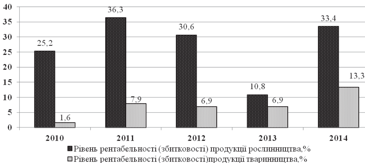
Рис. 2. Рівень рентабельності реалізації сільськогосподарської продукції у Черкаській області за 2010-2014 рр.

втрати права на одержання компенсаційних коштів суб'єктами АПК. Дані таблиці 2 показують, що вітчизняна державна підтримка сільського господарських підприємств Черкаської області характеризувалась невеликими обсягами прямої державної підтримки (пряма бюджетна підтримка наразі надається лише галузі тваринництва, але її обсяг досить незначний – 50 млн грн у рік) та значимими за обсягами преференціями зі сплати ПДВ.