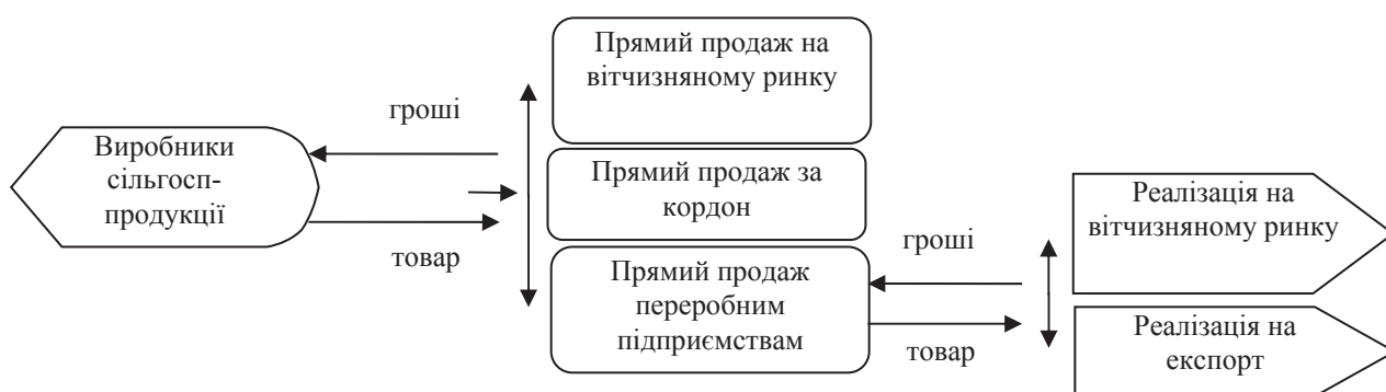
Рис. 2. Система товароруку сільськогосподарської продукції

Система товароруку ґрунтується на забезпеченні доставки продукції в те місце, де вона потрібна, у той час, коли вона потрібна, у таких кількостях, в яких її можна продати, такої якості, яка відповідає очікуванням споживачів, і охоплює сферу господарської діяльності підприємства – від її виробництва до місця продажу (рис. 2).